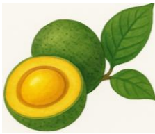
Q – QUATI