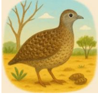
O - ONÇA-PINTADA