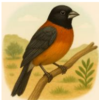
S – SABIÁ