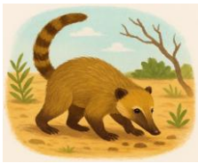
R – RUFÃO