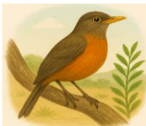
T – TUCANO