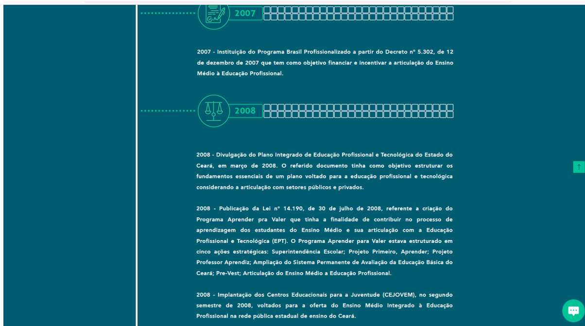
Figura 5 – Detalhamento por Período (LTE das EEEPs)