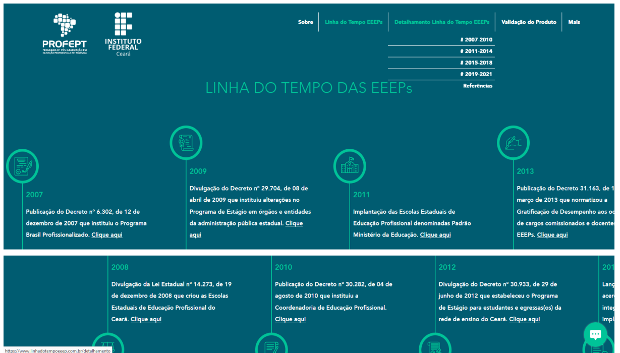
Figura 3 – Linha do Tempo das EEEPs (Geral)

https://www.linhadotempoeep.com.br/linha-do-tempo .