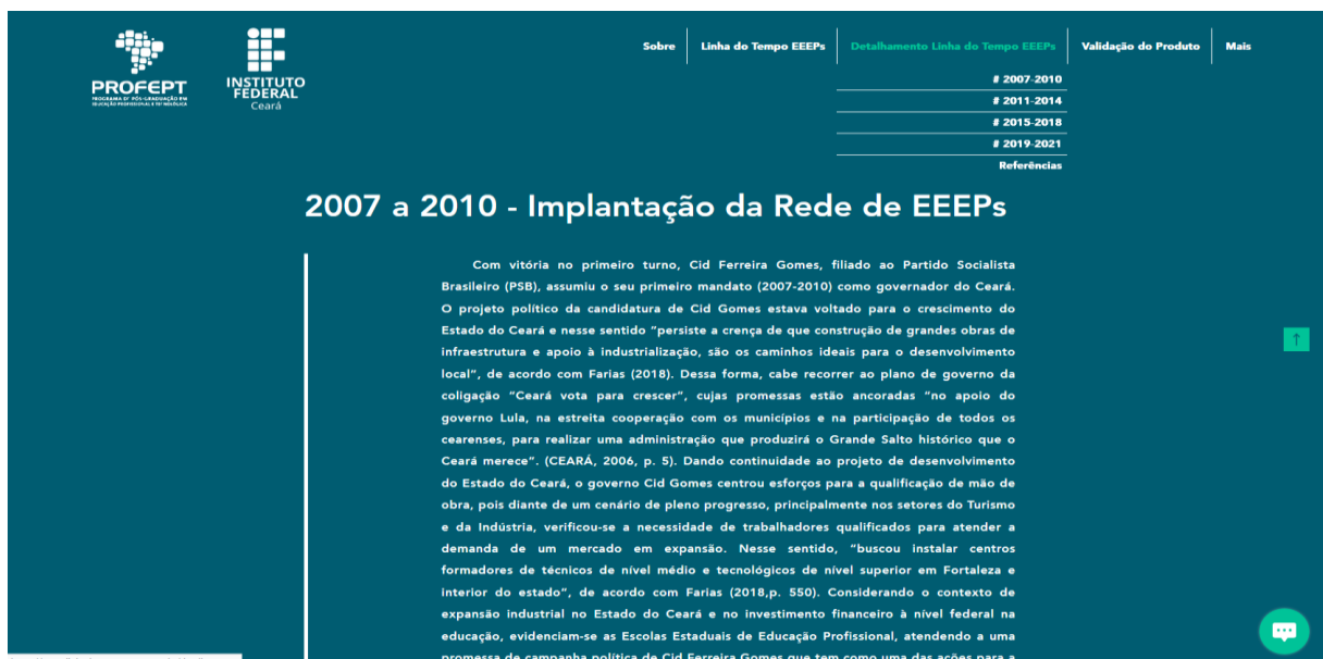
Figura 4 - Contextualização por Período (Recorte 2007 a 2010)