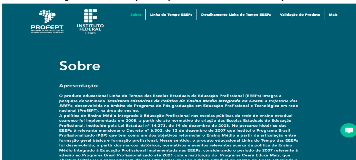
Figura 1 – Tela de Apresentação do Website Linha do Tempo das EEEPs

O produto educacional foi elaborado a partir da seleção de templates editáveis com interface intuitiva disponíveis na plataforma Wix.com, empresa israelense de elaboração de websites com a utilização de recursos online , disponível nas versões mobile , específica para dispositivos móveis como smartphones e tablets ; e desktop , versão para computador. O usuário tem acesso ao website Linha do Tempo das EEEPs, através do localizador eletrônico de recursos (URL) https://www.linhadotempoeep.com.br/ . Na figura 1 consta a página inicial do Website Linha do Tempo das EEEPs, contendo as cinco abas de acesso ao ambiente online .