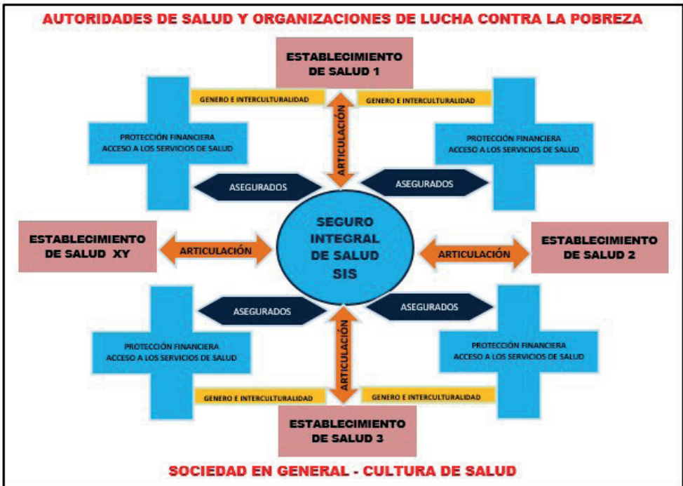
FIGURA 8 Síntesis del Plan de Mejora