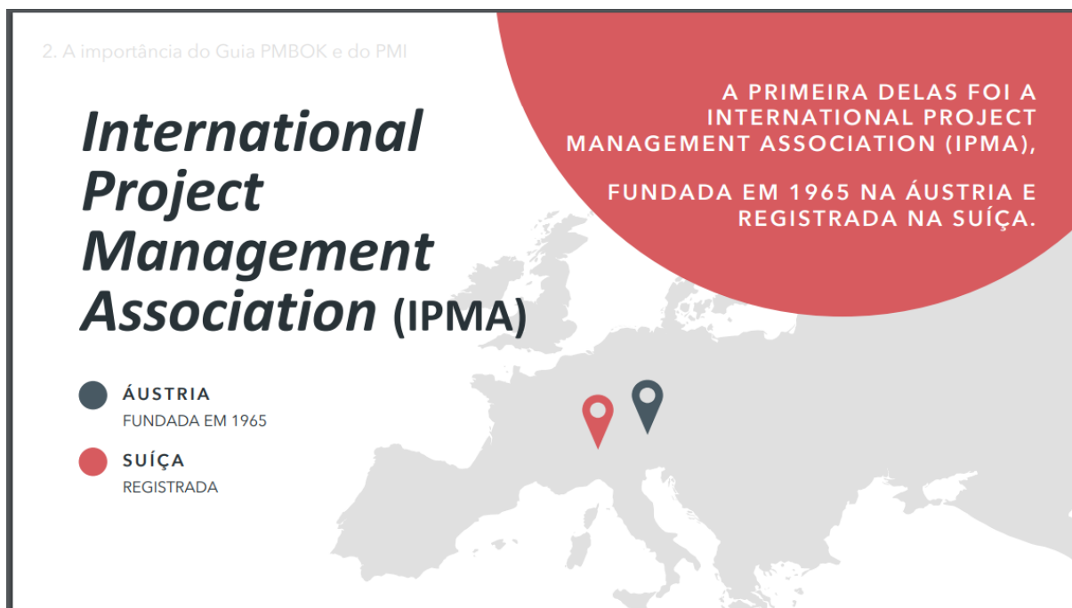
Figura 2 – International Project Management Association (IPMA)