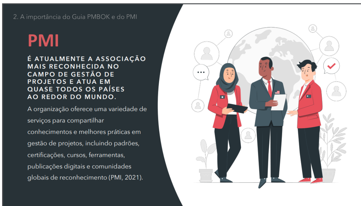
Figura 5 – PMI