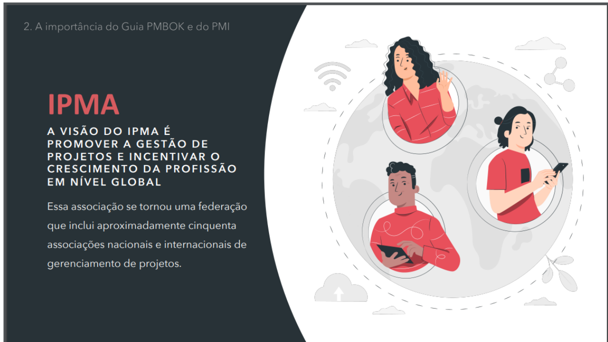
Figura 3 – A importância do Guia PMBOK e do PMI