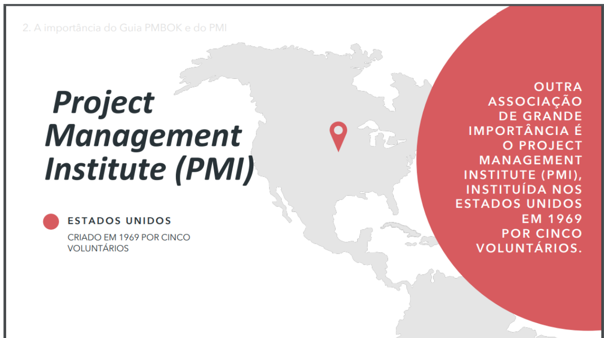
Figura 4 – Project Management Institute (PMI)