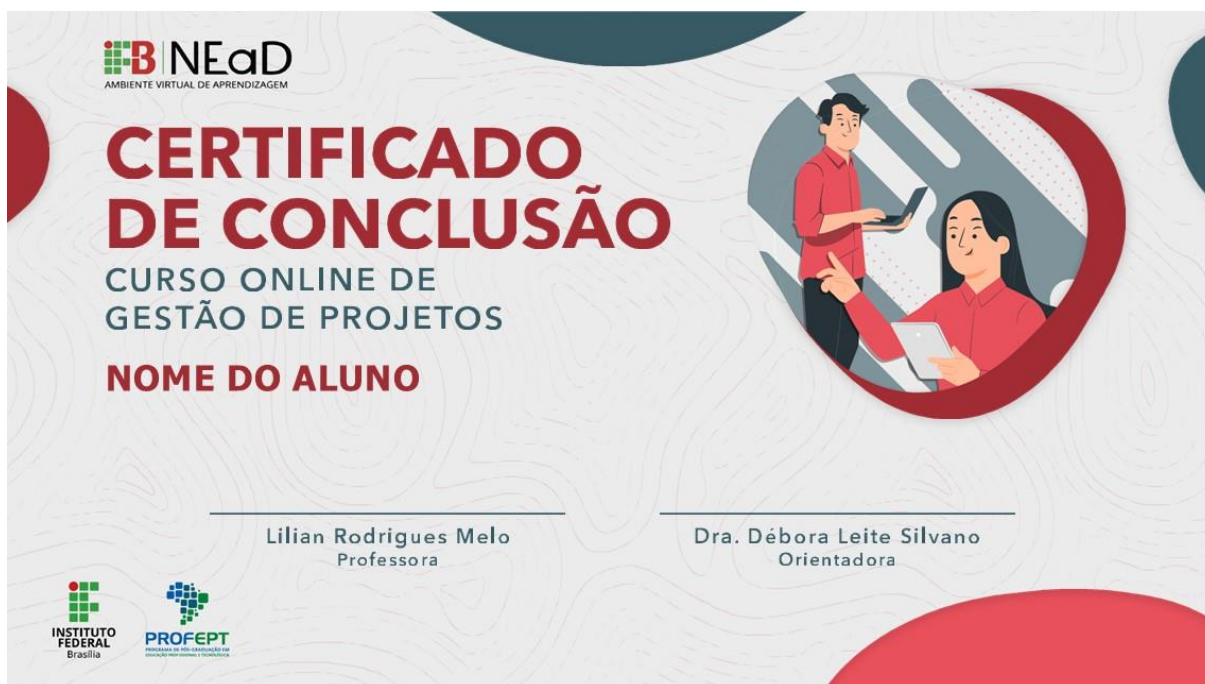
Figura 9 – Certificado