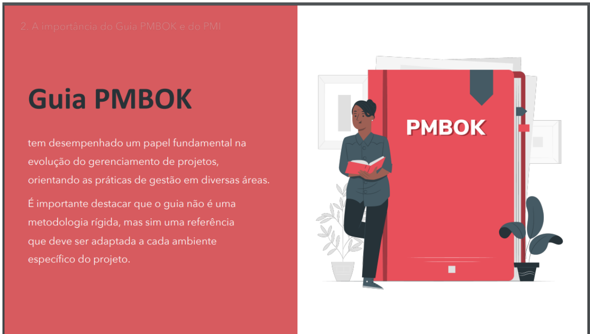
Figura 7 – Guia PMBOK