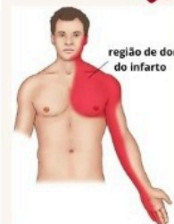
região de dor do infarto