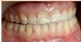
Erosão (desgaste) dos dentes