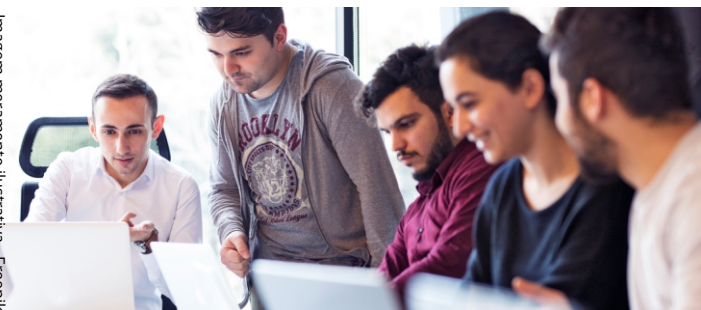
Imagem meramente ilustrativa