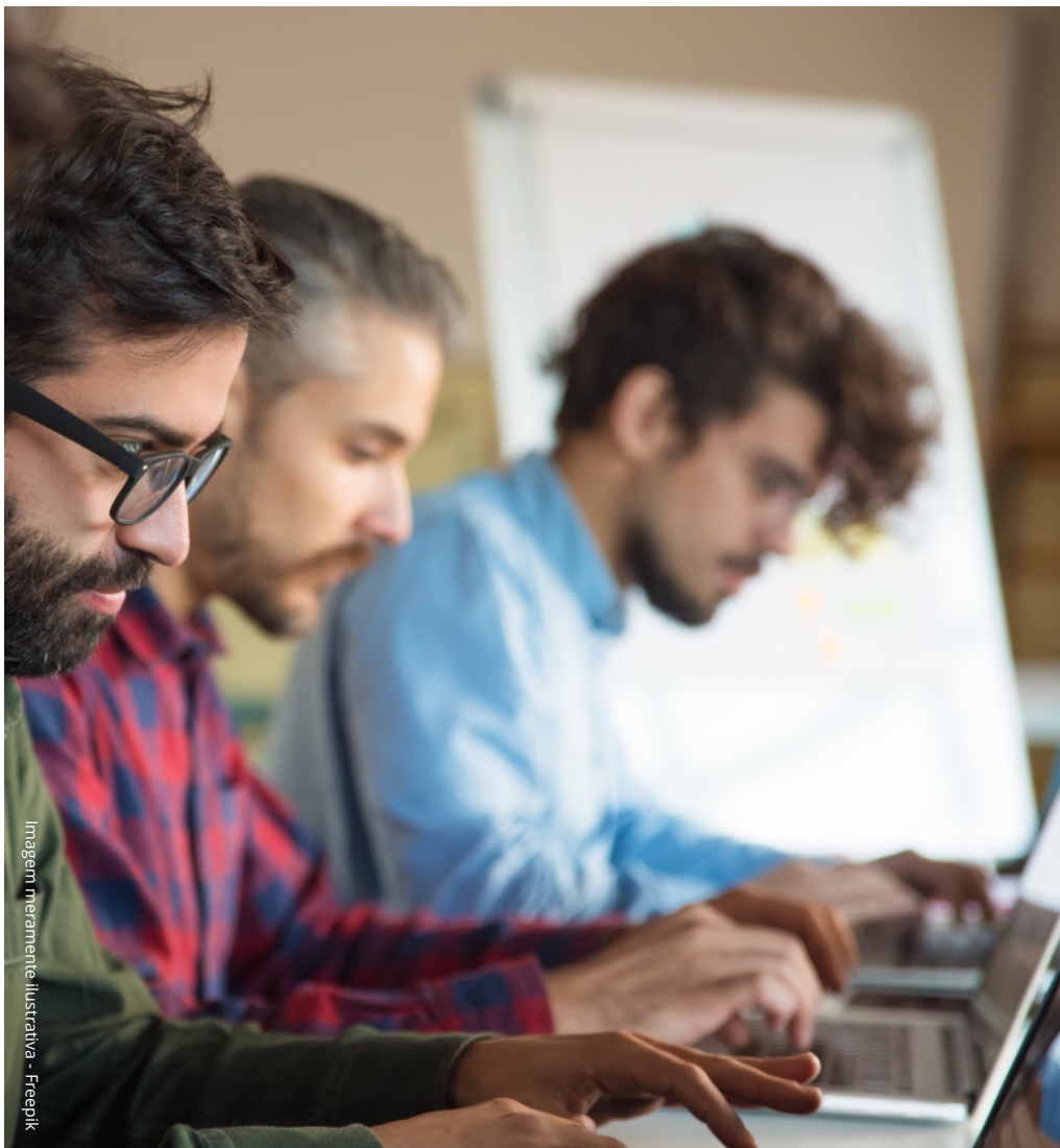
Imagem meramente ilustrativa