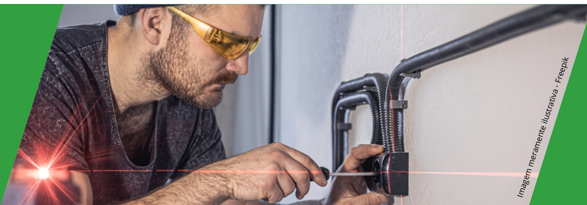
Imagem meramente ilustrativa