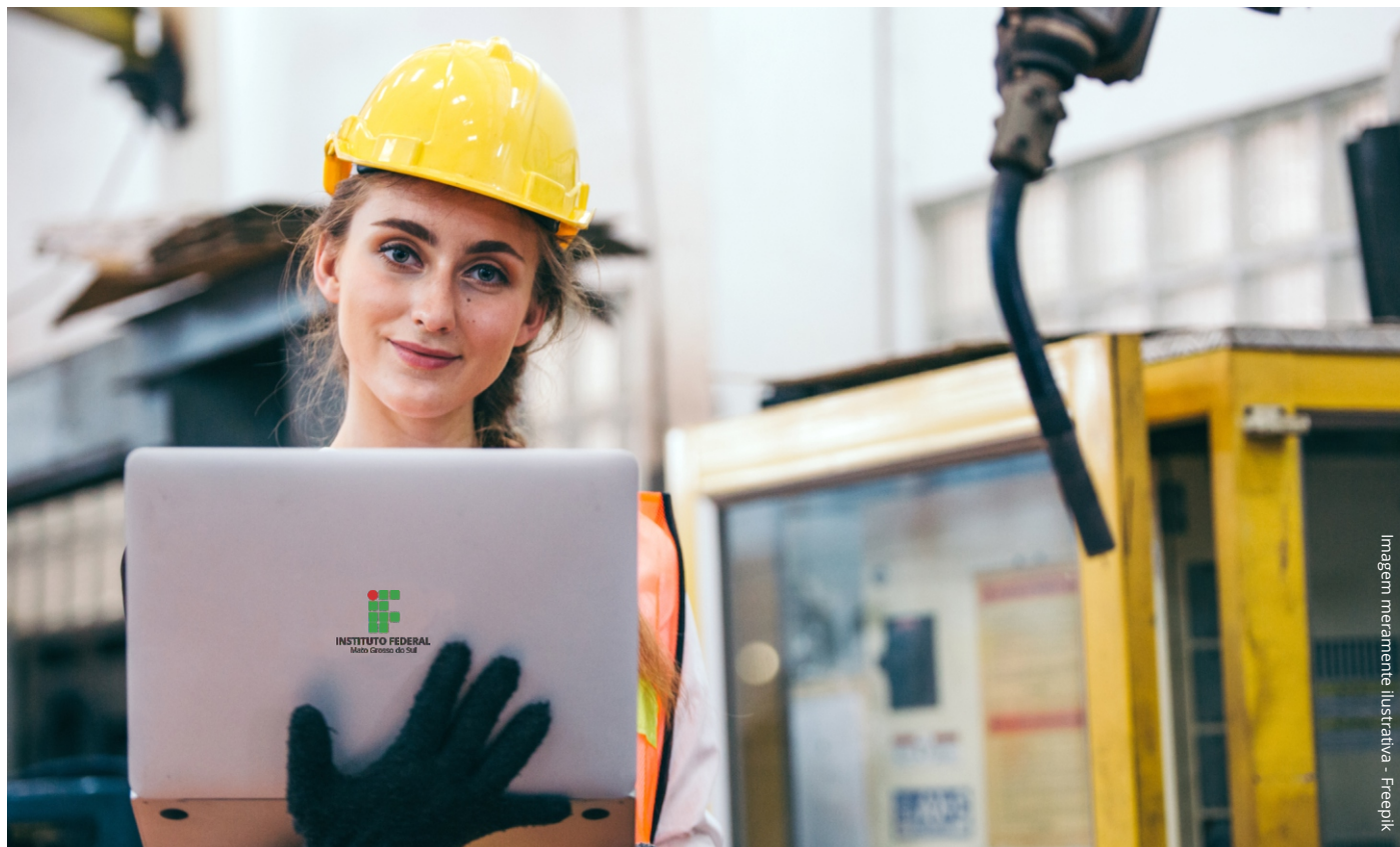
Imagem meramente ilustrativa