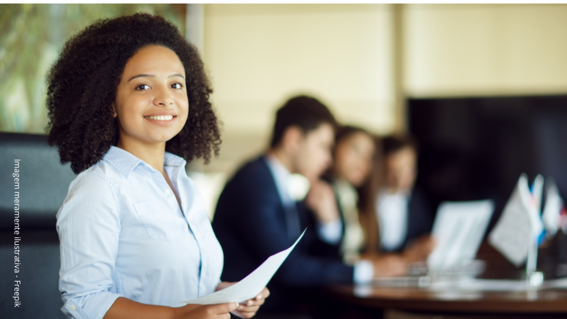
Imagem meramente ilustrativa

O guia aborda detalhadamente dos processos e procedimentos que regem os estágios obrigatórios, fornecendo orientações claras e práticas para os alunos.