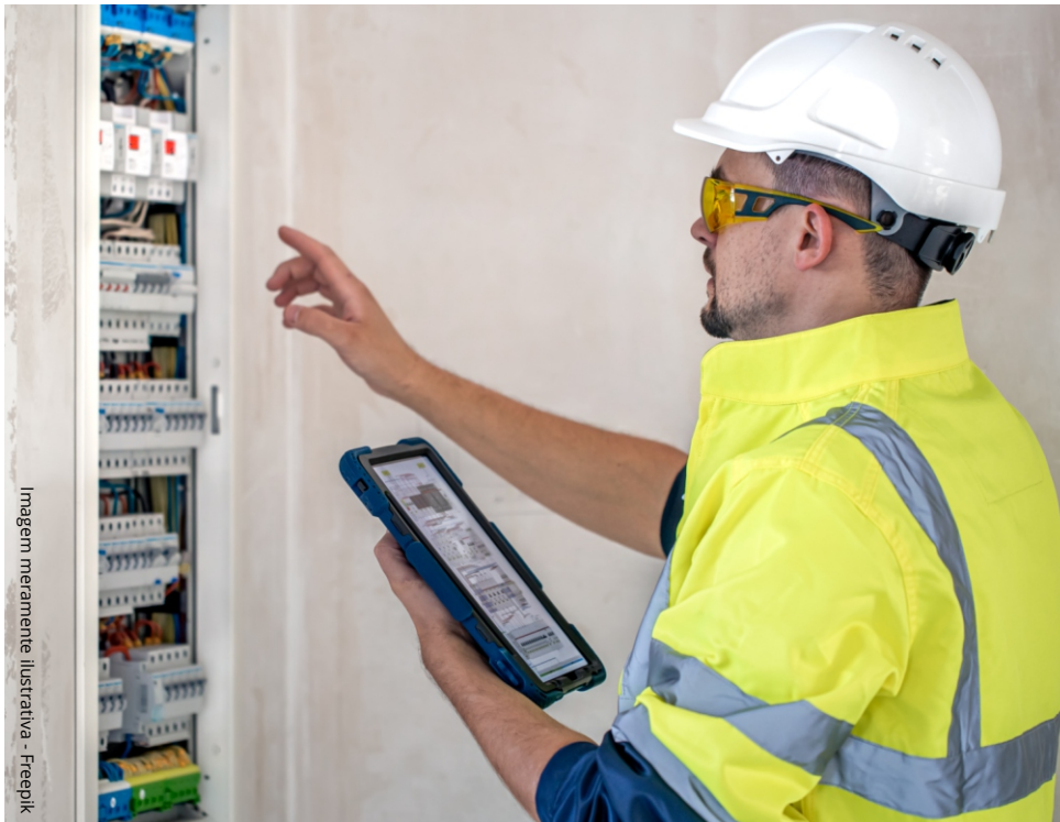
Imagem meramente ilustrativa