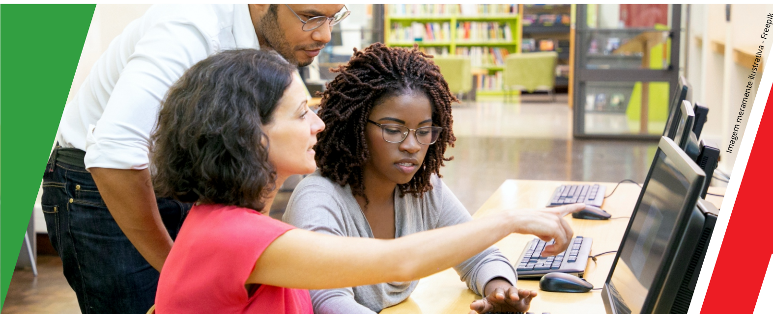
Imagem meramente ilustrativa