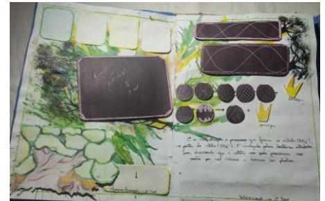
Fig. 3 Reações do ciclo do nitrogênio.