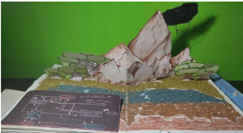
Fig. 4 Ciclo do nitrogênio representado em pop-up seu funcionamento.