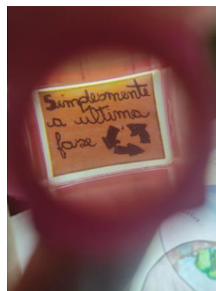
Fig. 5 Visualização do final da estória + história.