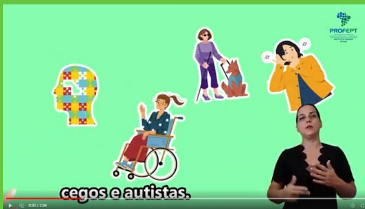
Imagem do vídeo animação

Nesse slide trouxemos imagens de pessoas com deficiência, para enfatizar o atendimento do NAPNE conforme destaque no regulamento em seu Capítulo 2, art. 4º, definido pela Resolução CS/IFS nº 76, de 06 de maio de 2021