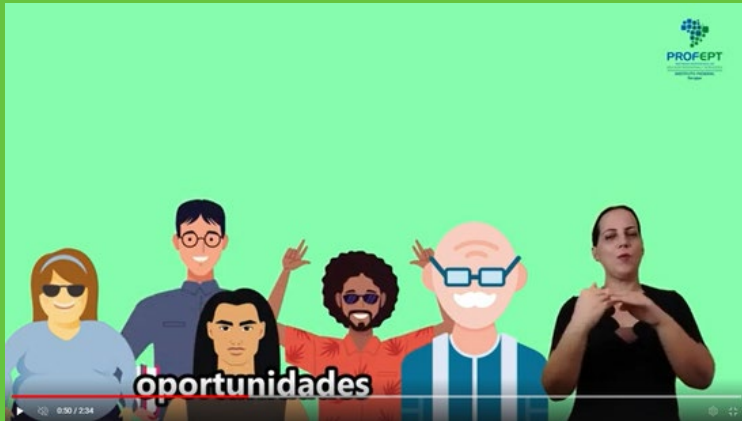
Imagem do vídeo animação

Nesse slide enfatizamos o trabalho do NAPNE quanto a um de seus, em relação a promoção do respeito as diferenças.