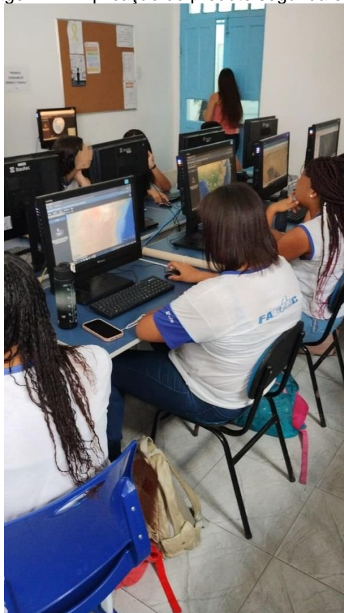
Imagem 4 – Aplicação do produto segunda etapa