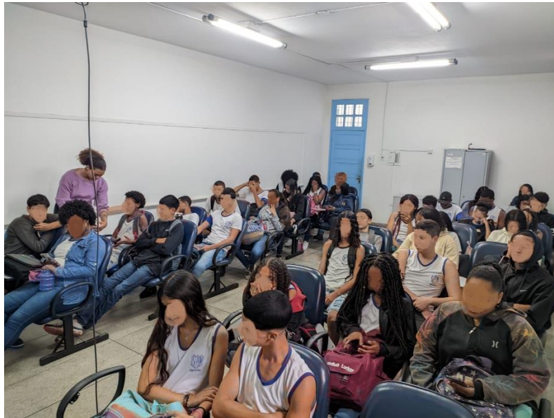
Imagem 2 – Aplicação do produto primeira etapa