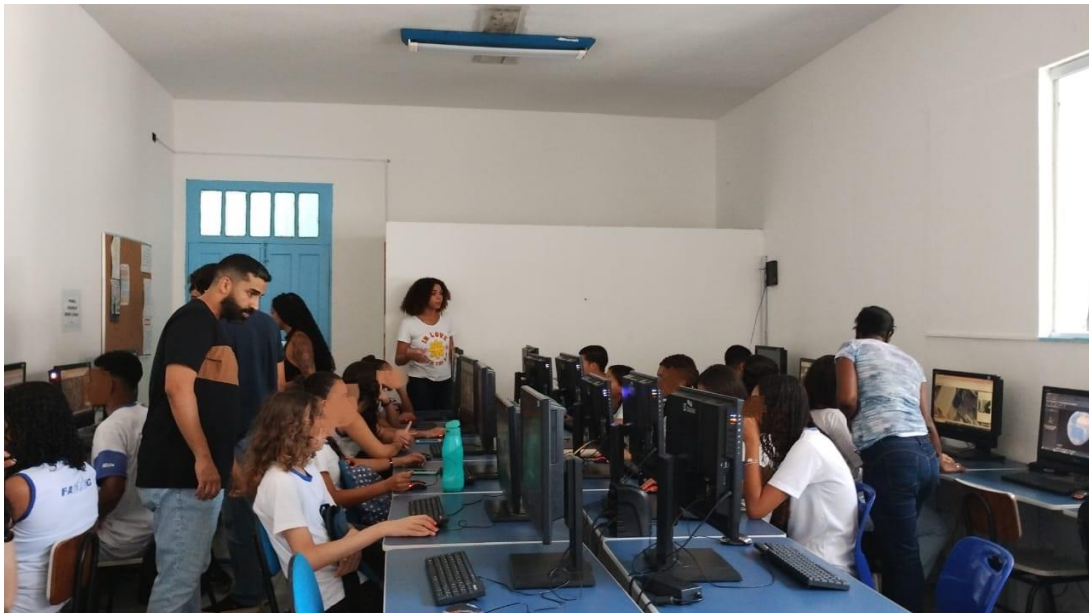
Imagem 3 – Aplicação do produto segunda etapa