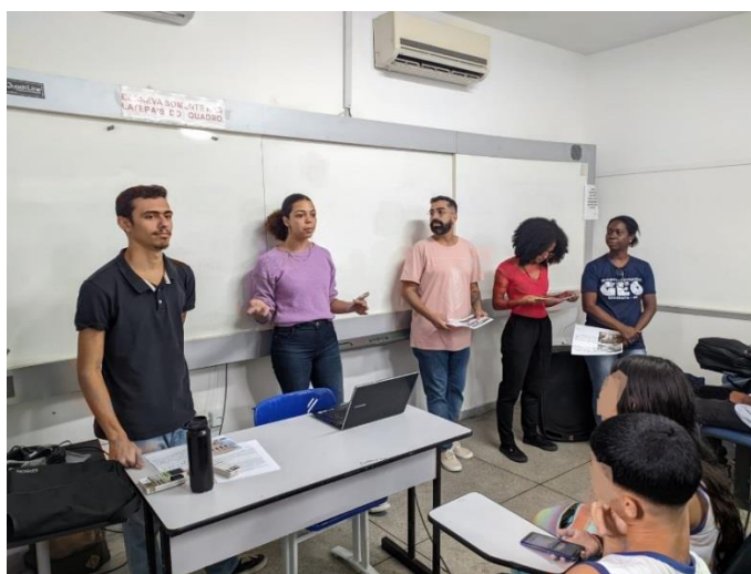
Imagem 1 – Aplicação do produto primeira etapa

Creemos que a maior dificuldade enfrentada, foi identificar um horário para que aplicássemos de forma contínua para todas as turmas, sem a aula ser dividida em muitas etapas, ao final, tivemos que repartir o projeto em dois dias para uma turma. Creemos que caso fossemos aplicar novamente o produto, nos atentariamos mais ao calendário da instituição para que pudessemos fazer em um início de semestre, assim garantindo mais tranquilidade e flexibilidade para o produto.