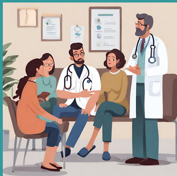
IMAGEM AUTORAL POR IA CANVA