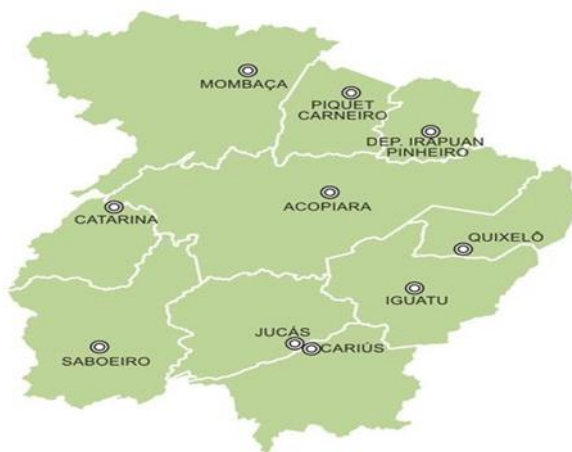
FIGURA 3- Localização e Composição da 18a Região de Saúde do Município de Iguatu. Estado do Ceará, 2017.