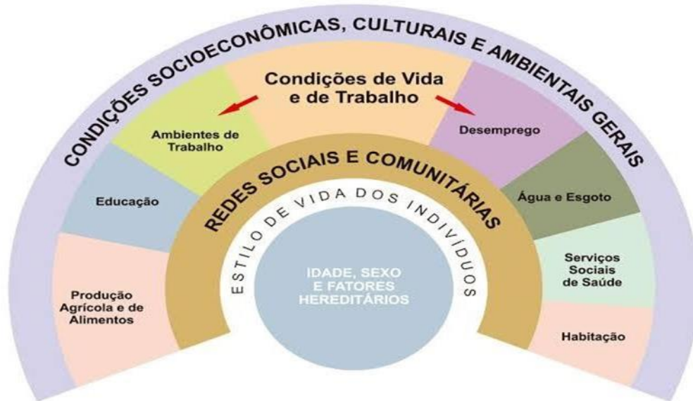
FIGURA 1- Determinantes Sociais de Saúde.