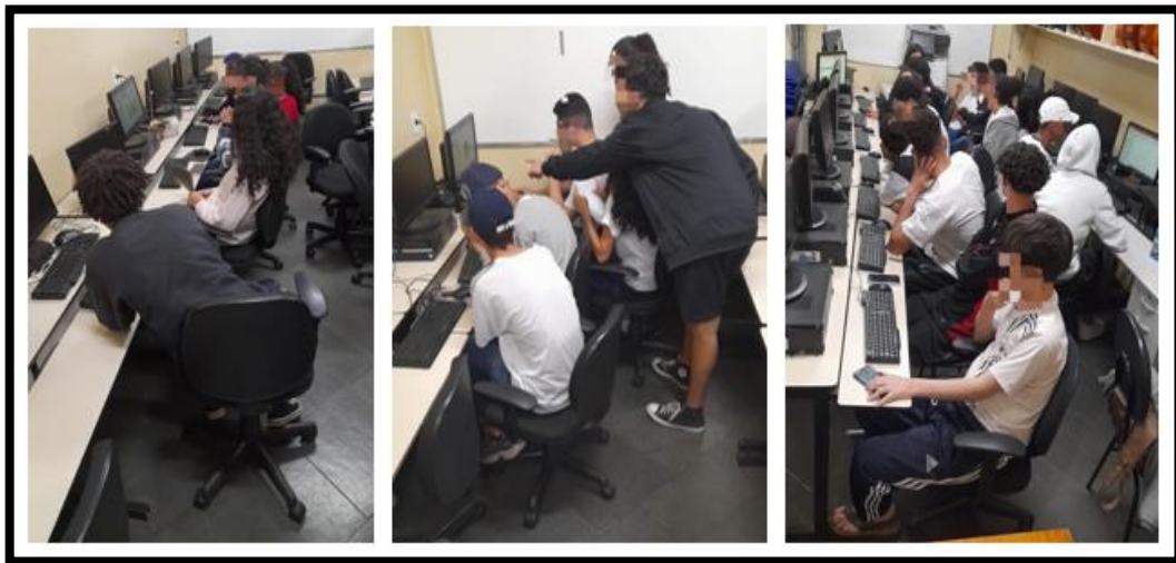
Figura 4 – Elaboração dos slides

Apresentamos também uma proposta de concretização do processo de ensino e aprendizagem para que possa realizar com seus estudantes. Em nossa pesquisa, após a aplicação dos roteiros de entrevista aos Pais/Responsáveis, os grupos de estudantes realizaram a análise dos resultados das entrevistas tabulados, elaborando os slides com os resultados de cada tema dispostos em gráficos, no laboratório de informática da escola. A Figura 4 apresenta registros dos três grupos nessa etapa.