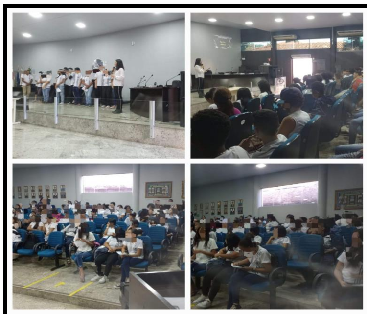
Figura 6 – Apresentação dos Resultados

A apresentação dos resultados foi realizada pelos grupos de estudantes, de acordo com a proposta inicial da SEI. A mediação foi realizada por mim, na condição de Professora da Eletiva de Educação Financeira, sendo os Estudantes os protagonistas do evento. A Figura 6 apresenta alguns registros da apresentação dos resultados.