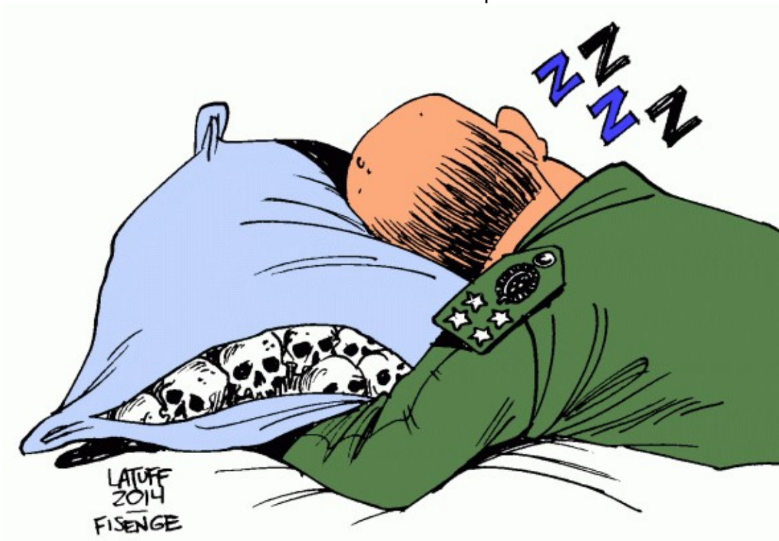
Figura 7: Charge “Quem combateu a ditadura já foi julgado nos centros de tortura. Já os torturadores continuam impunes”.

Disponível em: https://latuffcartoons.wordpress.com/2014/04/16/quem-combateu-a-ditadura-ja-foi-julgado-nos-centros-de-tortura-ja-os-torturadores-continuam-impunes/ . Acesso em: 10 de julho de 2023