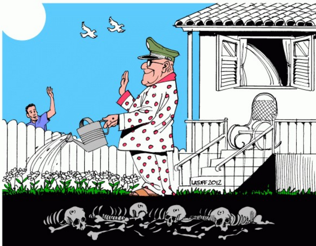
Figura 3: Charge “A tranquila vida dos torturadores da ditadura militar no Brasil”

Disponível em: https://latuffcartoons.wordpress.com/2012/06/22/charge-psisejufe-a-tranquila-vida-dos-torturadores-da-ditadura-militar-no-brasil/ . Acesso em: 10 de julho de 2023