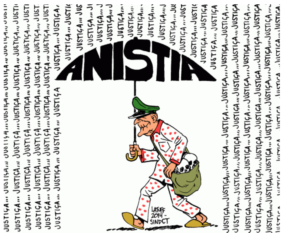
Figura 4: Charge “A lei de anistia e os torturadores de pijamas”

Disponível em: https://latuffcartoons.wordpress.com/2012/06/22/charge-psisejufe-a-tranquila-vida-dos-torturadores-da-ditadura-militar-no-brasil/ >. Acesso em: 10 de julho de 2023