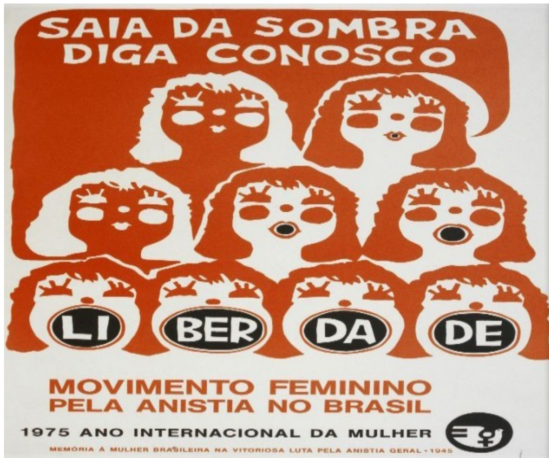
Figura 1: Cartaz do Movimento Feminino pela Anistia 1975

Disponível em: https://memoriasdaditadura.org.br/origens-do-golpe/ . Acesso em 25 de junho de 2023