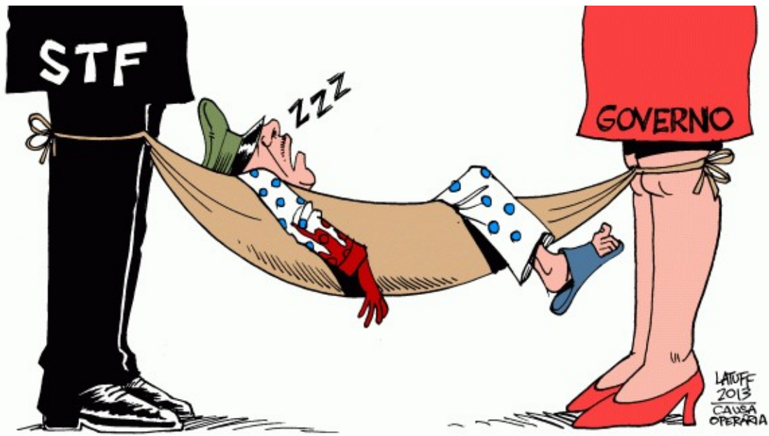
Figura 6: Charge: “Lei de Anistia no Brasil”

Disponível em: https://latuffcartoons.wordpress.com/2013/05/30/charge-causaoperaria-lei-de-anistia-no-brasil/ . Acesso em: 10 de julho de 2023.