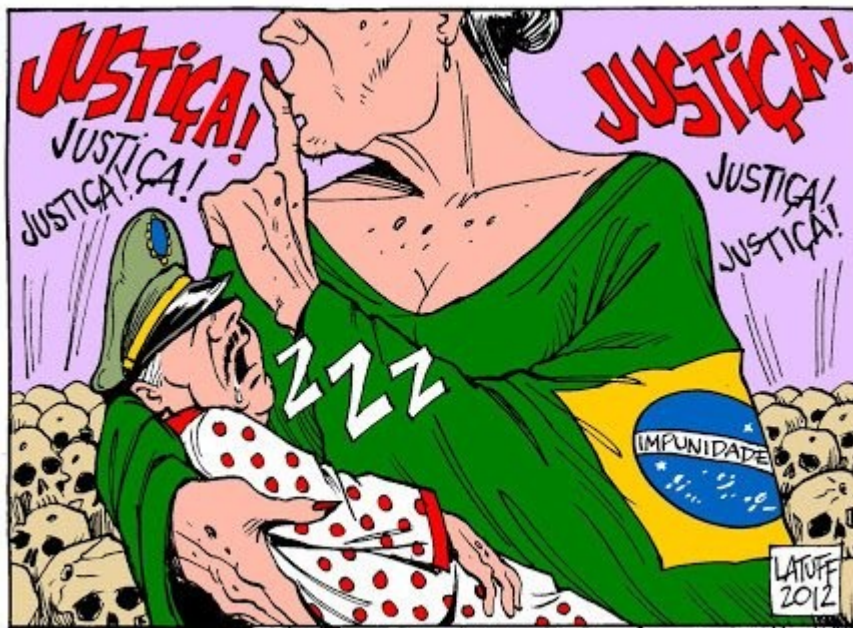
Figura 2: Charge “O Estado Brasileiro e os torturadores da ditadura”

Disponível em: https://latuffcartoons.wordpress.com/2012/06/01/charge-pfisenge-o-estado-brasileiro-e-os-torturadores-da-ditadura-militar/ . Acesso em: 10 de julho de 2023