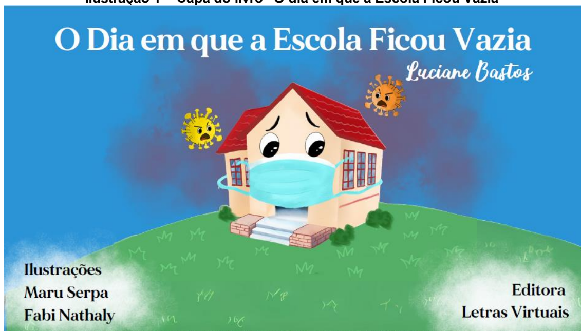
Ilustração 1 – Capa do livro “O dia em que a Escola Ficou Vazia”