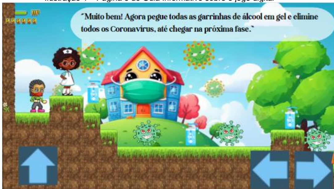
Ilustração 4 – Página 6 do Guia Informativo sobre o jogo digital

Com o uso das máscaras, o jogador sai do “isolamento” da escola, buscando novas medidas de prevenção contra o coronavírus. Nessa segunda fase, o jogador tem que coletar todas as garrafinhas de álcool em gel e elimine todos os Coronavírus, até chegar na próxima fase.