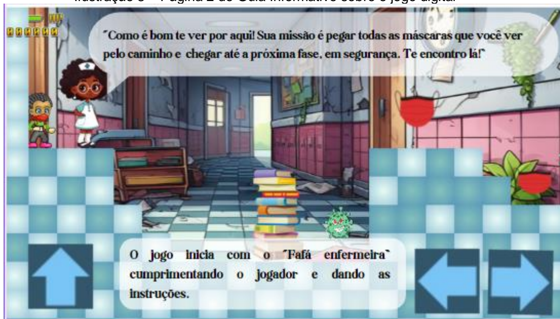
Ilustração 3 – Página 2 do Guia Informativo sobre o jogo digital