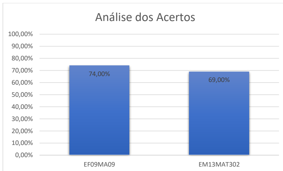
Gráfico 04 – Porcentagem de acertos no questionário de saída.

associar os termos semelhantes, oferece ao docente novas oportunidades para explorar abordagens que capacitem os alunos a se desenvolverem de maneira mais eficaz. Isso resulta em um método que os discentes percebem como mais elegante, dinâmico e até mesmo mais fácil de resolver problemas.