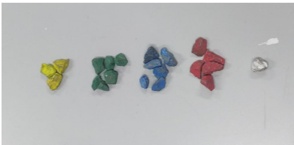
Figura 02 – Resultado da Adição.

As Figura 01 e Figura 02 são aplicações de métodos diferenciados para a construção dos conhecimentos sobre a operação de adição entre polinômios, onde cada cor de pedra representa termos diferentes em cada polinômio.