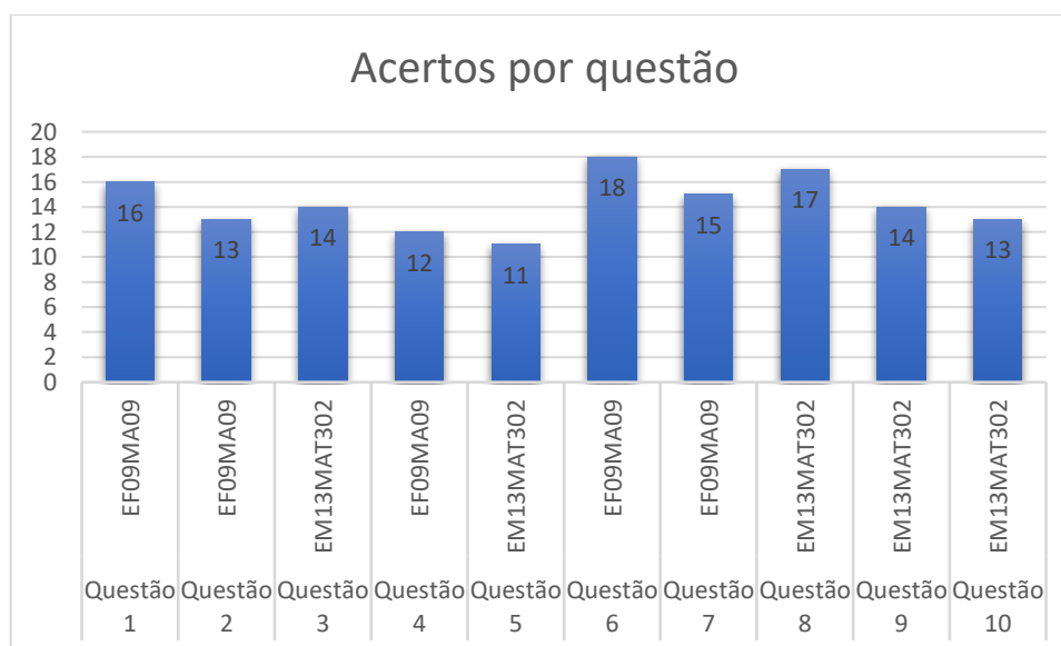
Gráfico 03 – Dados de saída.

Um gráfico foi criado para relacionar as questões por habilidades, permitindo assim visualizar claramente a significativa melhoria nos resultados quantitativos após a implementação da intervenção pedagógica com a turma.