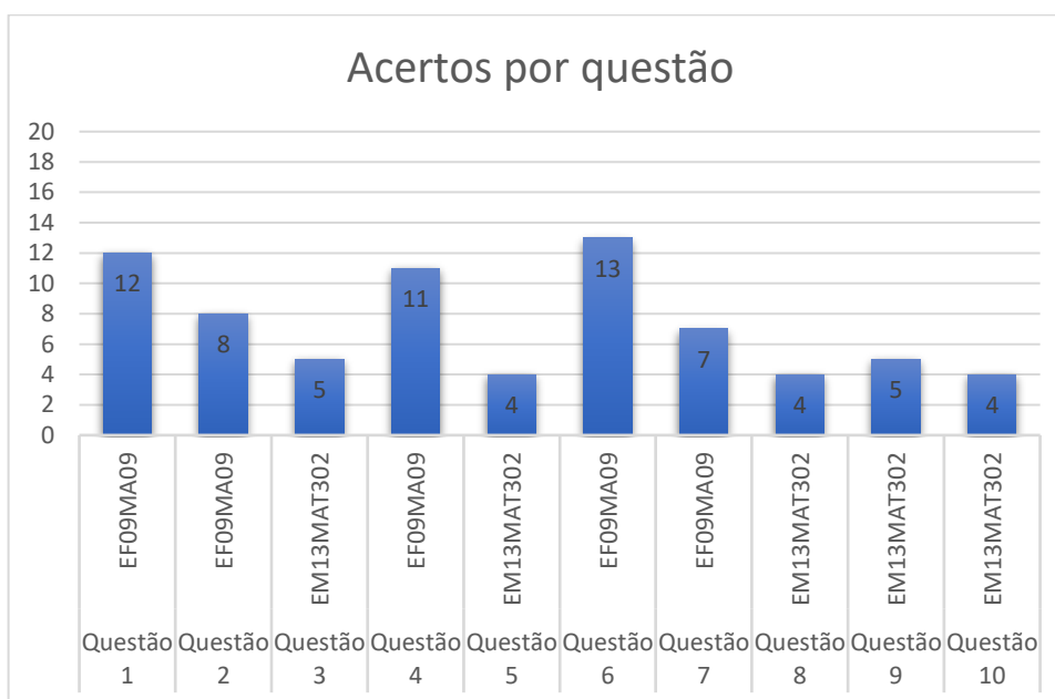
Gráfico 01 – Dados de entrada.