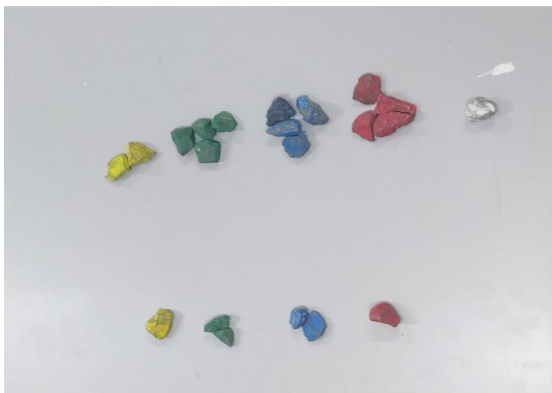
Figura 01 – Operação de adição entre as pedras.

analogia de pedras coloridas, como associar duas pedras azuis, três amarelas, duas verdes e duas vermelhas com a soma entre outro agrupamento de pedras onde tem-se quatro pedras vermelhas, três azuis e uma branca. Os alunos serão capazes de associar aquelas que possuem as mesmas cores, de modo a compreender os termos semelhantes a serem agrupados assim como mostra as Figura 01 e Figura 02.