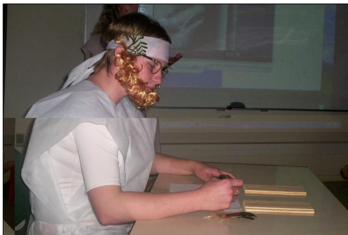
Figura 13: Personagem Tales de Mileto.

Finalizaram a apresentação em uma sala de aula normal, de uma escola qualquer, na qual a professora estava explorando exatamente o conteúdo acima. As Figuras 13 e 14 ilustram momentos distintos da apresentação da peça teatral.