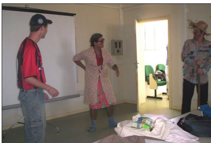
Figura 11: Peça teatral 'Áreas e Volumes'.

A apresentação, além de divertida, foi de fácil entendimento por parte dos colegas, ficando o conteúdo acessível. O texto não era fechado em si, percebendo-se a improvisação dos componentes no decorrer da apresentação, o que a deixou ainda mais leve e agradável. As Figuras 11 e 12 ilustram a apresentação dessa peça teatral sobre áreas e volumes.