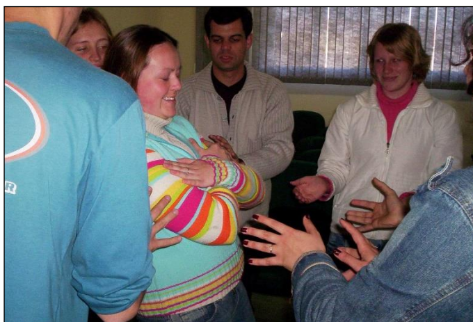
Figura 5: Jogo 'João Bobo'.

Logo após, deu-se continuidade à aula com os jogos previstos que, além do espírito em equipe, buscaram pela concentração dos acadêmicos. O mais interessante foi que, na aplicação do João Bobo , a preocupação com os colegas aumentou, mostrando seriedade em meio ao prazer na execução das atividades propostas. Esse fato pode ser percebido na Figura 5, relacionada ao jogo.