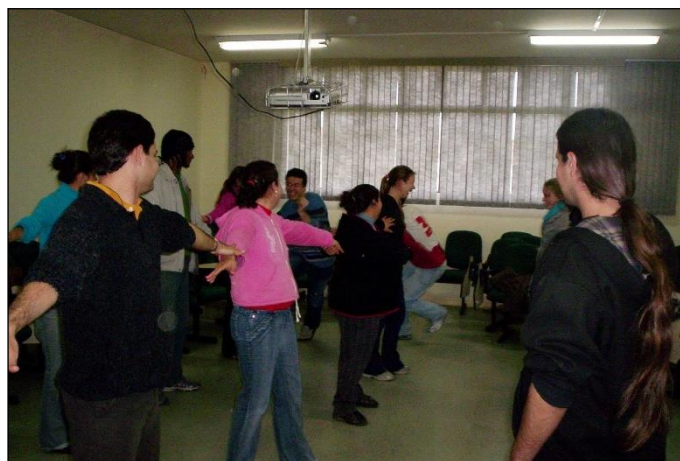
Figura 10: Jogo ‘Ruas e vielas’.

O segundo jogo destacado foi Ruas e vielas , por seu dinamismo e espírito de estratégia por parte daquele que dá os comandos. A Figura 10 ilustra os acadêmicos jogando Ruas e vielas , na qual é possível ver o alinhamento formado.