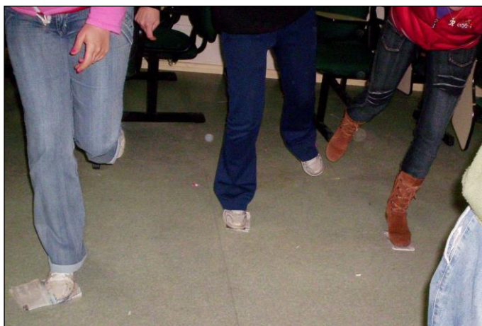
Figura 9: Jogo ‘Dança no jornal’.

Dos Jogos Teatrais trabalhados relacionando diretamente conceitos matemáticos, dois ganharam destaque na fala dos acadêmicos: primeiro, a Dança no jornal , no qual se explorou o conceito de potência através de dobras consecutivas em uma folha de jornal, conforme troca-se a música. A Figura 9 mostra alguns dos acadêmicos já em folhas bem dobradas do jornal.