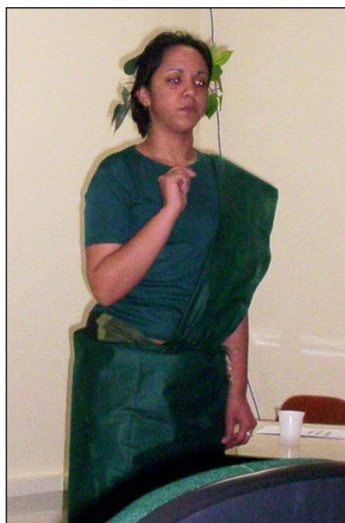
Figura 18: Personagem Pitágoras.

Todo o vivenciado entre Matemática e Teatro, para os acadêmicos, “ tem ajudado como motivação para que eu como futura professora tenha mais vontade de desenvolver uma aula mais divertida e que desperte o interesse do aluno ” (PUMBA) e “ além das ideias para serem aplicadas aos meus alunos, me sinto motivada e encorajada a aplicar as ideias e a criar novas opções ” (DENGOSO). “A motivação faz parte da ação. É um momento da própria ação. Isto é, você se motiva à medida que está atuando, e não antes de atuar”. (FREIRE; SHOR, 1986, p. 15).