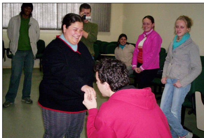
Figura 7: Jogo 'Declarações'.

As Declarações tinham como foco a memorização por parte dos acadêmicos de dois conceitos muito utilizados em Matemática, a fórmula de Bhaskara e o Teorema de Pitágoras, depois do entendimento do significado de cada um deles. Os comentários foram que quando forem trabalhados esses conteúdos no Ensino Fundamental, os alunos possam relembrá-los associando-os a fatos cotidianos e de importância em suas vidas. A Figura 7 ilustra a declaração romântica realizada na turma.