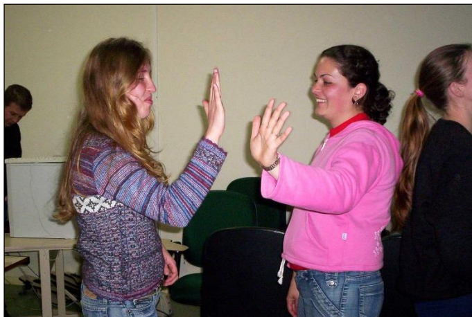
Figura 6: Jogo do 'Espelho'.