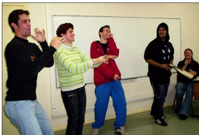
Figura 4: Jogo 'Juntar-se ao colega'.

No último jogo, Juntar-se ao colega , a solidariedade e o espírito de equipe ficaram claramente demonstrados, pois não somente um ou dois alunos executaram a cena proposta, mas um grande grupo. A Figura 4 ilustra este fato, por meio da encenação de um grupo musical no jogo citado anteriormente, com saxofonista, tecladista, vocalista, guitarrista e baterista.