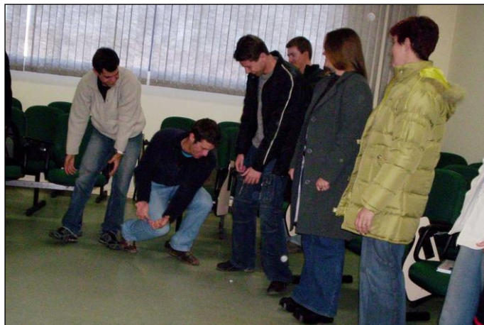
Figura 2: Jogo 'Passar bola'.