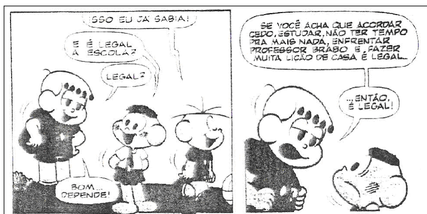
Figura 1: O último ano antes da escola.

Outro recurso que pode ser aproveitado também em aulas de Matemática é a história em quadrinhos. Ilustrando o fato, a pesquisadora levou para o grupo a história O último ano antes da escola , da revista Cascão 20 . Nela, o personagem principal, Cascão, escuta de seu amigo Franjinha que, quando se começa a ir à escola não se tem mais tempo de brincar e de se divertir, por isso ele que aproveitasse muito bem seu último ano de 'liberdade'. Com um terrível medo dominando seus pensamentos, Cascão decide fugir de casa no dia seguinte. Nessa fuga, observa um dia de aula do Franjinha, percebendo que aquilo escutado do amigo não era verdade, sendo a escola muito legal, com diferentes oportunidades e possibilidade de bons amigos. Na Figura 1 um pequeno trecho da história: