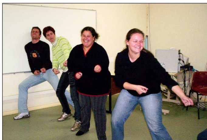
Figura 3: Jogo 'Cabo de guerra sem corda'.

Os jogos relacionados no segundo encontro tinham como foco desenvolver a expressão vocal e corporal nos acadêmicos. A Figura 3 ilustra o jogo Cabo de guerra sem corda , na qual se percebe a expressão corporal dos alunos, através da idealização de uma corda imaginária para poderem jogar.