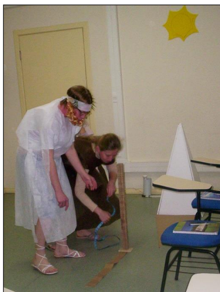
Figura 14: Peça teatral 'Teorema de Tales' e a medição da altura.

A fala de uma das acadêmicas envolvidas relata a percepção sobre a relação entre a encenação da peça teatral e o cotidiano: