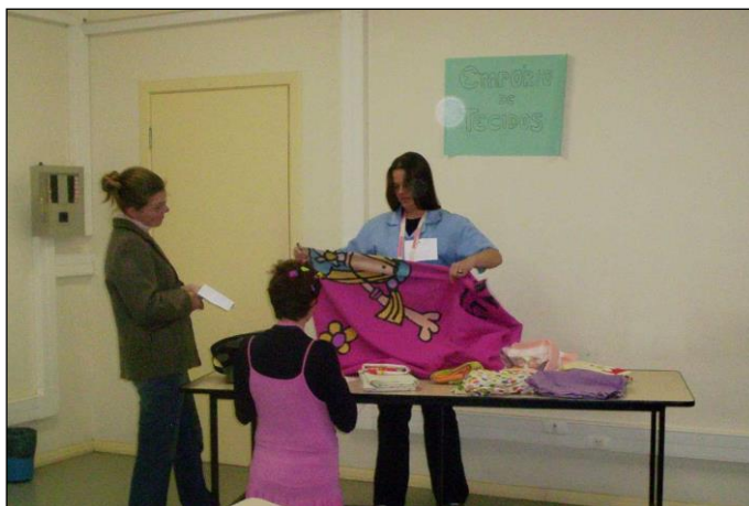
Figura 15: Peça teatral 'Empório de Tecidos'.

A questão discutida foi que a vendedora não conseguia realizar os cálculos referentes a metragem de tecido solicitada e o preço final da venda, sendo os mesmos realizados pela 'filha', que tinha boas aulas de Matemática na escola. Além disso, exploraram o metro e seus múltiplos e submúltiplos, através de uma aula relembrada pela mesma. As Figuras 15 e 16 ilustram a apresentação da peça.