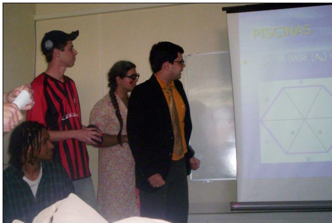
Figura 12: O engenheiro das piscinas.

Concluindo os comentários sobre o primeiro grupo, cita-se o depoimento de um dos envolvidos: