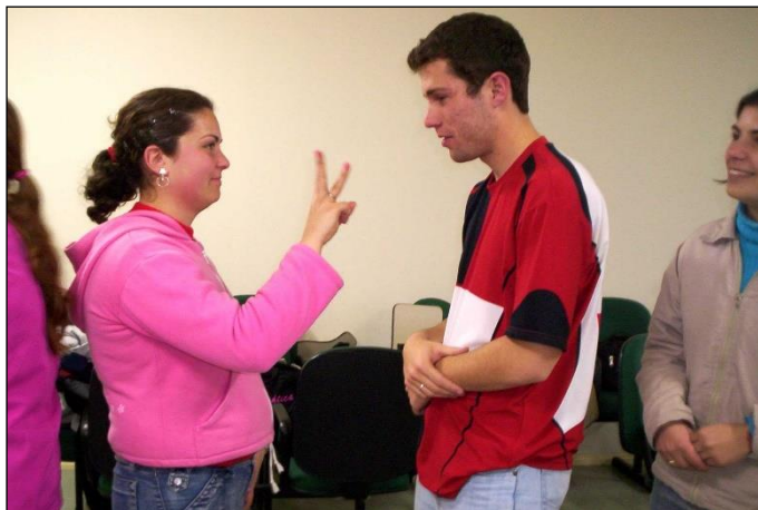
Figura 8: Jogo 'Fila do aniversário'.

A participação dos acadêmicos em todas as atividades propostas foi significativa, fazendo sentido entre o que experimentavam ali na sala e o que vivenciam fora da faculdade. Percebe-se isso através seguinte depoimento: “[...] no decorrer destes dois meses que nos encontramos nas aulas de IEM fomos participantes ativos de cada aula e não somente ouvintes ” (MINIE).