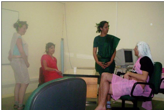
Figura 17: Peça teatral 'A Verdadeira História do Teorema de Pitágoras'.