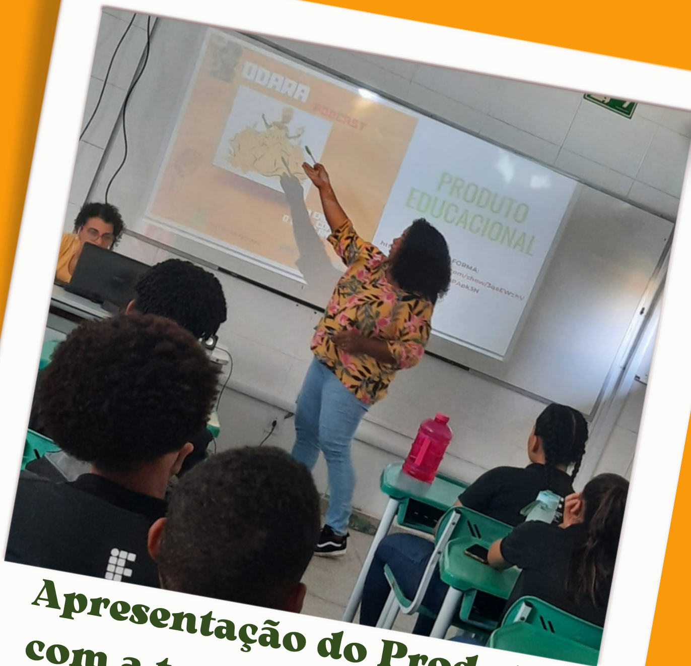
Apresentação do Produto com a turma do 3º ano de Eletrotécnica