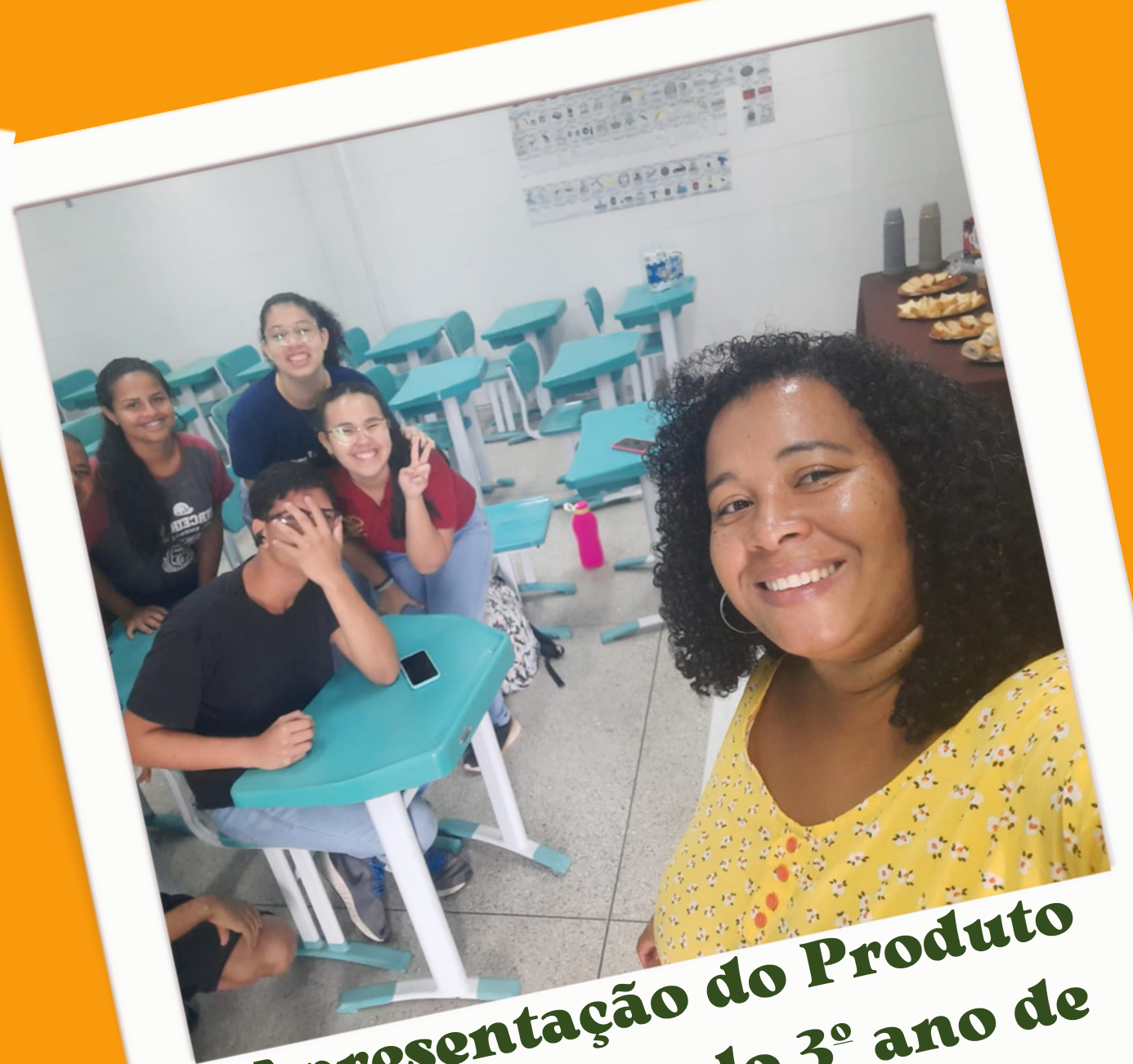
Apresentação do Produto com a turma do 3º ano de Edificações