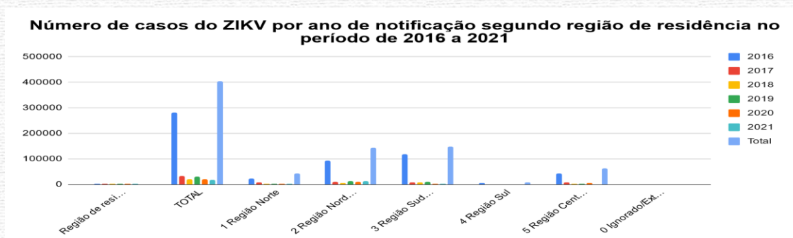
Gráfico 1 - Número de casos de infecção por ZIKV por ano de notificação segundo região de residência no período de 2016 a 2021.

Considerando o período escolhido, verificou-se que ocorreu o registro de 404.779 casos confirmados de infecção pelo ZIKV, sendo que o maior número de notificações ocorreram durante os anos de 2016 e 2017, com 281.464 e 32.684 casos, respectivamente. As regiões com maior incidência no Brasil no período de 2016 a 2021 foram o Sudeste e o Nordeste com o registro de 147.161 e 144.365 casos, respectivamente. Enquanto, no mesmo período, as regiões Centro-Oeste, Norte e Sul apresentaram 62.257, 42.672 e 8.275 casos, respectivamente (Gráfico 1).