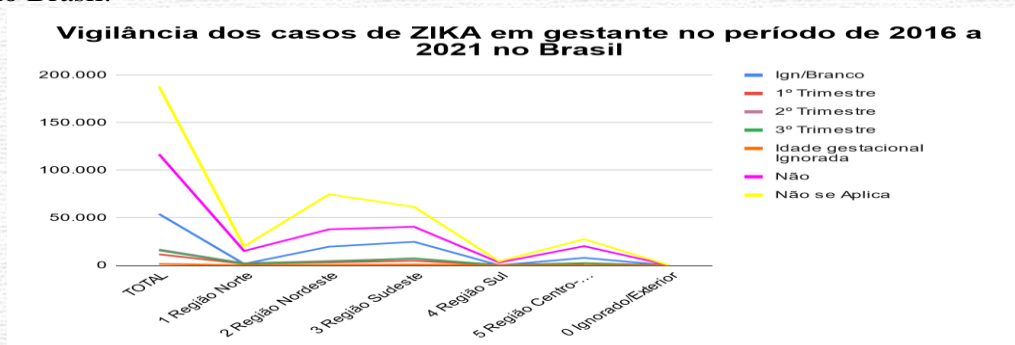
Gráfico 3 - Vigilância dos casos de infecção por ZIKV em gestantes no período de 2016 a 2021 no Brasil.