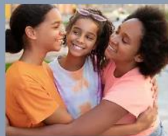
Identidade negra e estudantil, ganha força!

Aqui reunimos algumas reportagens, eventos e interações atuais de ações jovens que estão em curso, especialmente provocada pelo e para estudantes de escolas públicas pelo país.