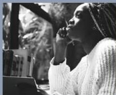
Leituras e Movimento

O interesse pela leitura e a busca por conhecimento fazem parte de uma pesquisa acadêmica. Mas como a teoria colocar em movimento? Com algumas referências bibliográficas e materiais didáticos, buscamos ajudar (re)pensar a Juventude, a Escola pública, Racismo e outros textos que colaboram para a construção deste produto e pesquisa.