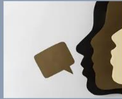
Prontxs para este desafio?

Você sabe o que é o Colégio de Aplicação da UFRJ (CAp-UFRJ)? Quer conhecer? Então, participe deste quiz e teste seus conhecimentos sobre a história, organização didática-administrativa e sobre o Coletivo de Estudantes Negros, de uma das instituições de educação mais antiga do país. APRENDA BRINCANDO!