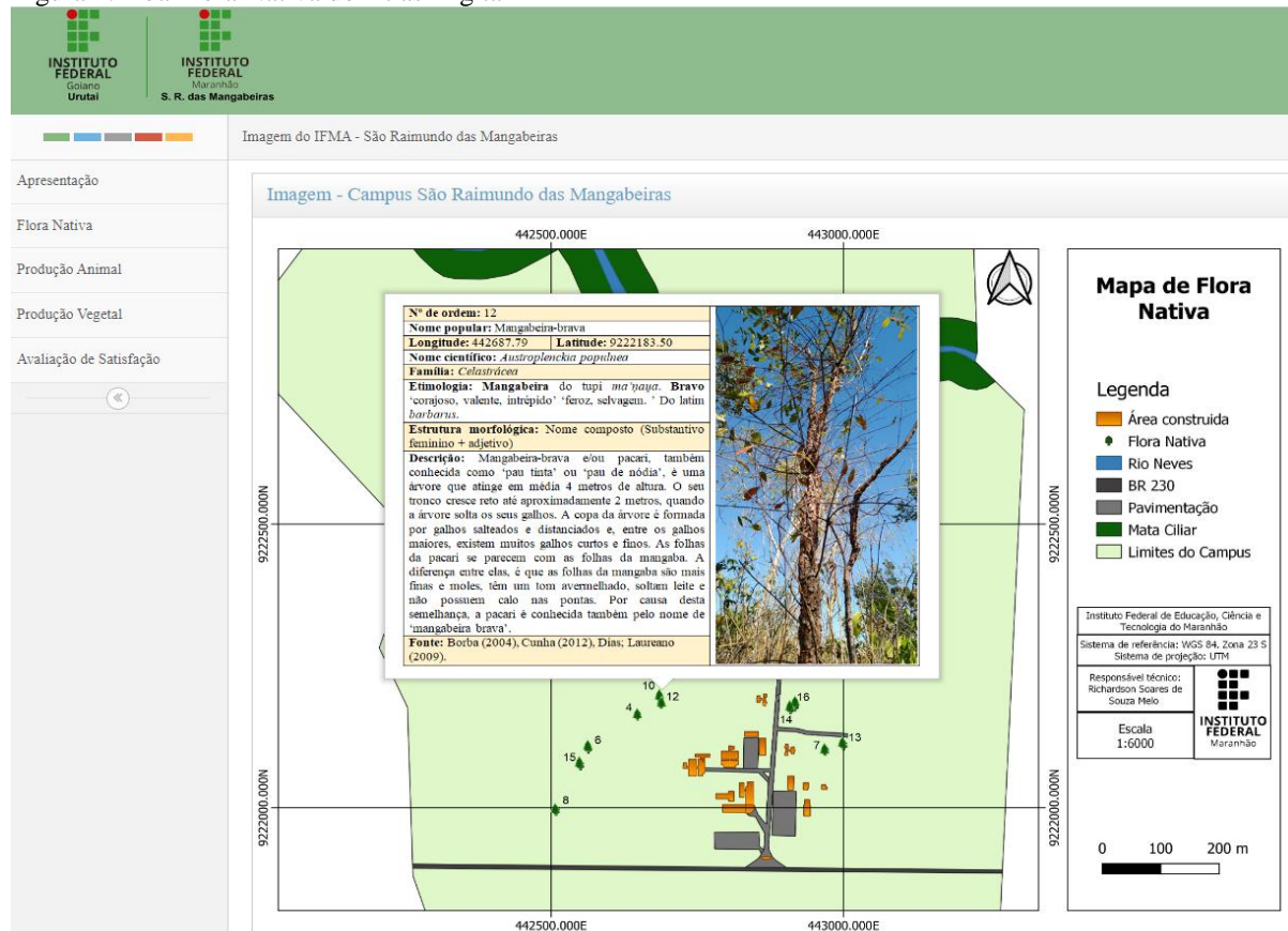
Figura 2: Aba Flora Nativa do Atlas Digital