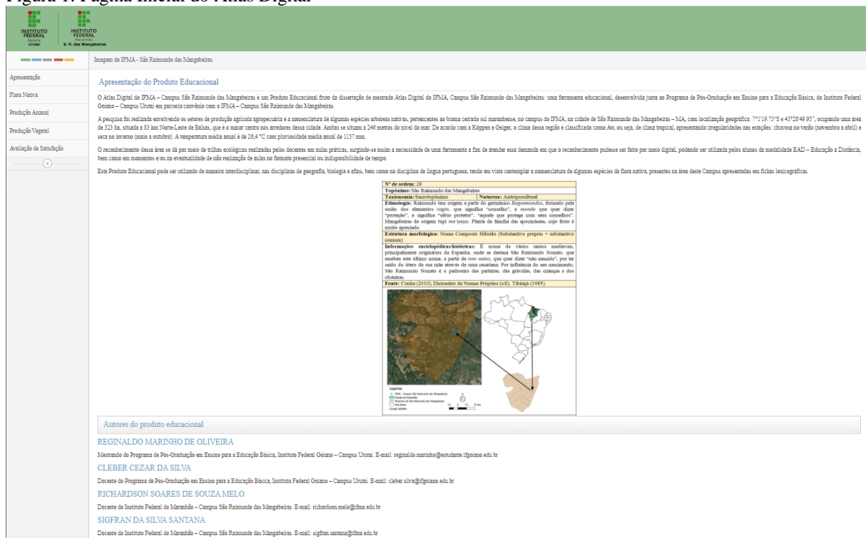
Figura 1: Página Inicial do Atlas Digital