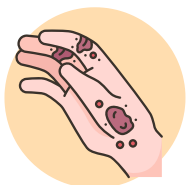
MAUS HÁBITOS DE HIGIENE