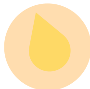
O PUS DE FERIDAS DE PESSOAS INFECTADAS