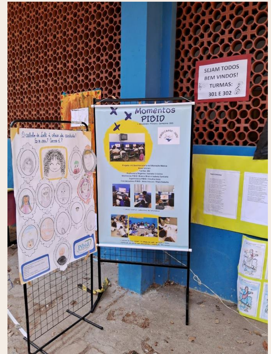
RESPONSÁVEIS DOS ALUNOS COMPREENDENDO A PROPOSTA DO PIBID

BANNER EXPOSTO NA FESTA DA CULTURA NO DIA 13 DE JULHO.