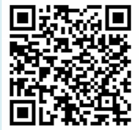
Figura 24 – QR code para acesso à versão digital do livro

A produção ultrapassou os muros da escola, sendo amplamente divulgado, via redes sociais da escola e dos próprios estudantes, agora escritores, por meio do link https://www.livrosdigitais.org.br/livro/214656B8ZZUD8VK e do QR code: