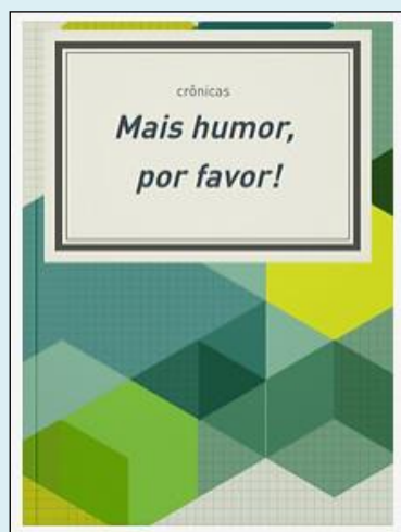
Capa do livro

O livro foi apresentado em uma espécie de “evento de lançamento”, onde cópias foram autografadas pelos próprios estudantes e disponibilizadas para leitura ao compor o acervo da sala de leitura e da biblioteca municipal.