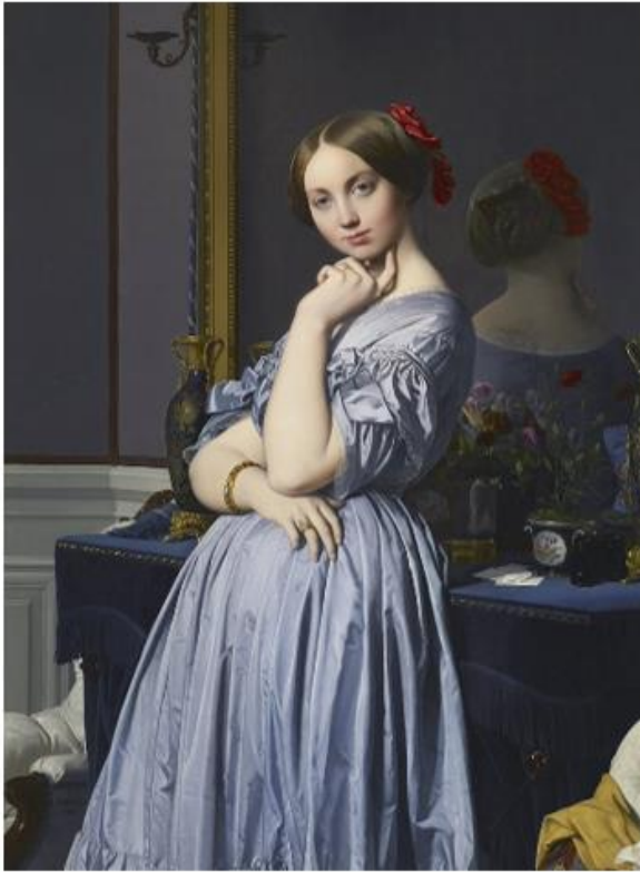
Fonte: Comtesse d'Haussonville - Jean-Auuste- Dominique Inares (1845)