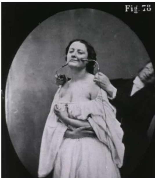
Figura 4: mulher com histeria