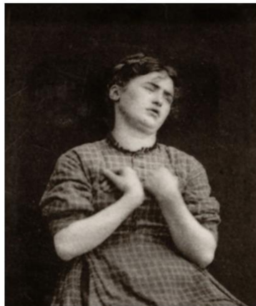
Figura 5: mulher com histeria