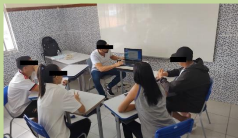
Figura 6: Senso comum identificado