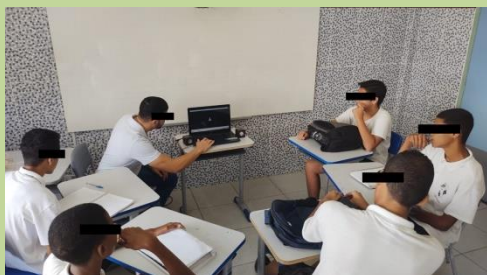
Figura 5: Pausas para discussão