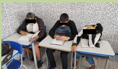
Figura 2: Anotação de temas relevantes