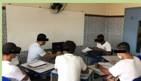
Figura 4: Reprodução dos vídeos