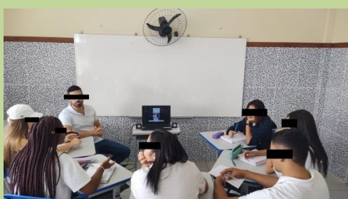
Figura 3: Exposição da opinião

Atividade 3: Com um notebook e uma pequena caixa de som na frente da sala é organizado um pequeno círculo de cadeiras. Em seguida os vídeos elaborados são reproduzidos para cada grupo. Os alunos relacionam as pesquisas científicas que fizeram com o senso comum contido nas produções autorais, observam retificações possíveis e necessárias. Erros dos conceitos e pesquisas complementares são indicados aos alunos pelo professor para ampliar a discussão iniciada. Conforme figuras de 3 a 6.