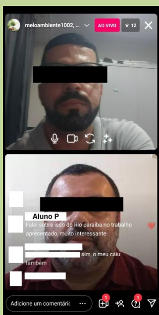
Figura 17: Reconhecimento da pesquisa pelo aluno.