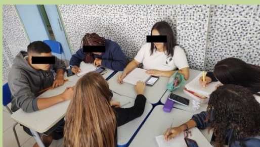
Figura 1: Debate em sala

Atividade 2: A sala é organizada nos 5 grupos definidos anteriormente e que fizeram os vídeos autorais, o professor orienta que os alunos usem os Smartphones para pesquisa dos conceitos científicos relacionados aos temas que exploraram nos vídeos produzidos. São indicados pelo professor sites científicos confiáveis e leituras mais densas sobre cada assunto. As figuras 1 e 2 ilustram essa etapa