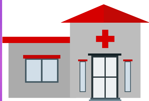
Posto de saúde