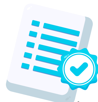
Comprovante de vacinação