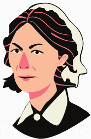
A própria Florence Nightingale.

A própria Florence Nightingale, fundadora da Enfermagem Moderna, é considerada uma das pioneiras do uso do método científico na medicina.