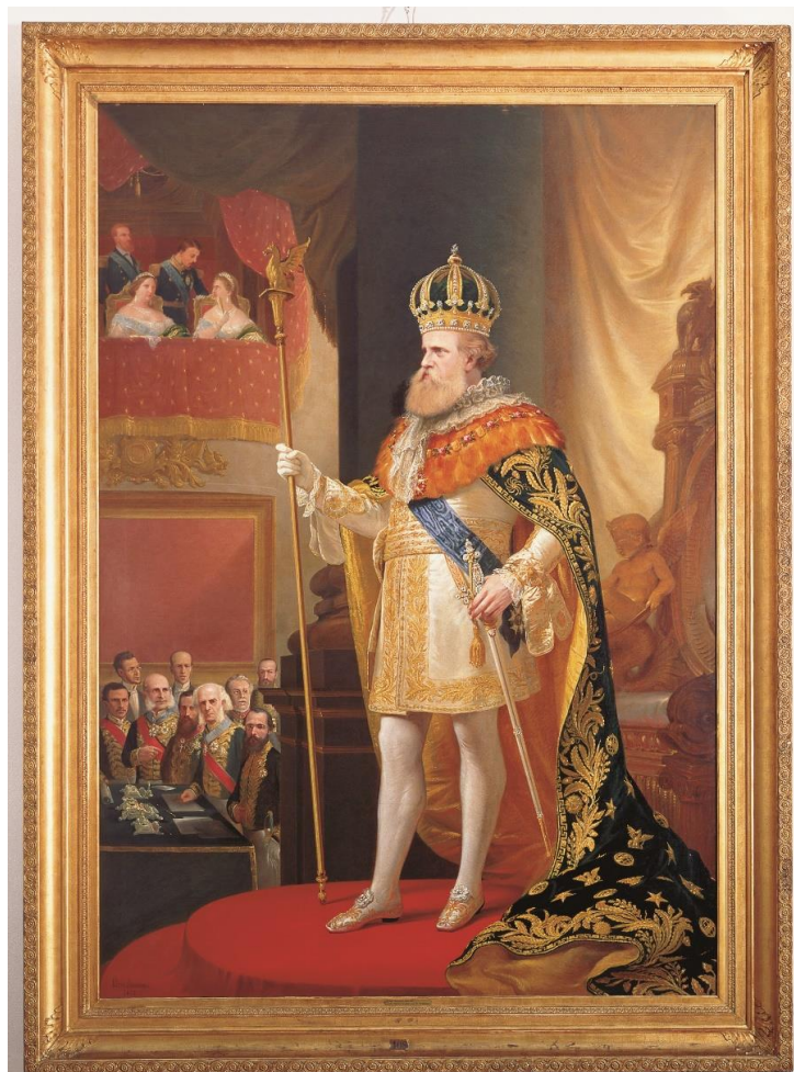
MELLO, Pedro Américo de Figueiredo e. D. Pedro II na Abertura do Parlamento; Fala do Trono. 1872, óleo sobre tela, 2,88 m x 2,05m. Coleção Museu Imperial. 126

Após a coroação, o traje do imperador não se tornou uma vestimenta de uso cotidiano, sendo usado, durante os 48 anos do reinado de D. Pedro II, apenas duas vezes ao ano, nas cerimônias de abertura e fechamento da Assembleia Geral. Essas eram as únicas ocasiões em que o Imperador era visto portando o traje majestático. Tal fato é retratado na pintura a seguir: D. Pedro II na abertura da Assembleia Geral, elaborada pelo artista Pedro Américo Figueiredo e Melo, em 1872. Esta obra está exposta na Sala do Segundo Reinado, como dito.