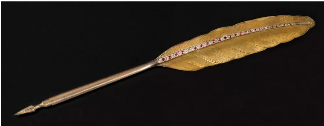
Pena usada na assinatura da Lei Áurea em 13 de maio de 1888. Pena em ouro, com ponta para escrita. Eixo principal cravejado de diamantes e pedras vermelhas. Dimensões: 3,5 cm (largura) x 22 cm (comprimento). Peso: 13,35g. Coleção Família Imperial 130 .

A pena é feita de ouro, tem 27 diamantes e 25 pedras vermelhas. Foi fabricada exclusivamente para a Princesa Isabel assinar a Lei Áurea e ofertada a ela por abolicionistas. A peça ficou sobre a salvaguarda dos descendentes da princesa, sendo inclusive emprestada para compor exposições temporárias, até ser comprada pelo Ministério da Cultura, em 2006, de Dom Pedro Carlos de Orleans e Bragança, bisneto da princesa Isabel, por R$ 500 mil.