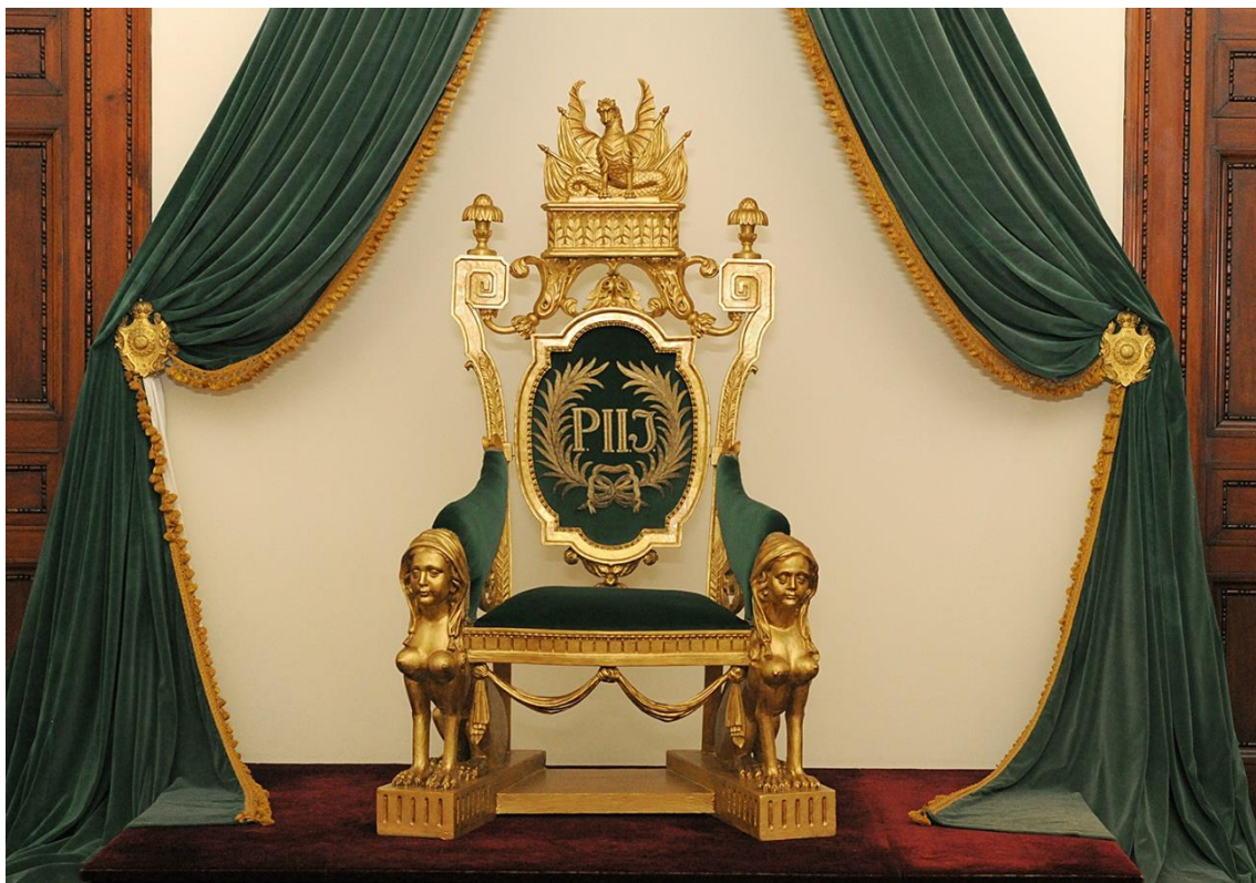
figura presente na mitologia grega com significados que remetem à sabedoria, poder e proteção.

Trono de D. Pedro II. Trono em madeira com trabalhos de entalhe, decorado com folha de ouro. Assento e braços revestidos em veludo assim como o encosto oval e emoldurado. No centro, bordados em fio de prata, a sigla "P. II. I." ladeada por duas palmas atadas por um laço. Material: madeira, veludo, folha de ouro, fio de prata. Dimensões: 175 cm (altura) x 104 cm (largura) x 66 cm (profundidade). Coleção Museu Imperial. 127