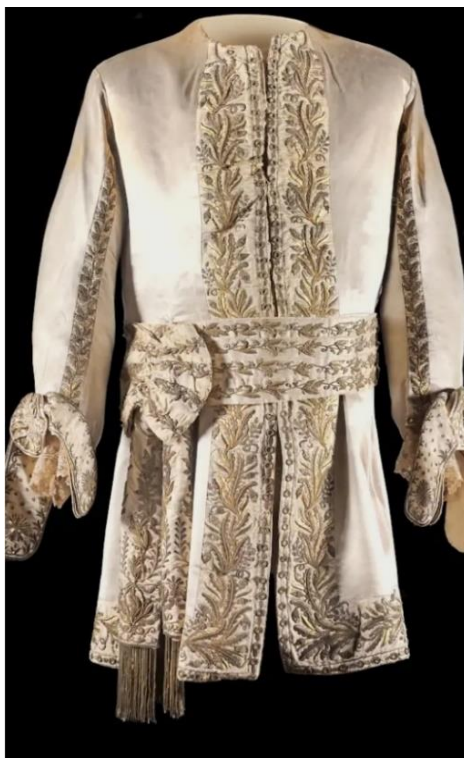
Traje majestático - Veste. Possui comprimento na altura dos joelhos, bordada a ouro com motivos de ramos de carvalho que contornam a abertura e a linha inferior em evasé. Mangas com os mesmos bordados. Material: cetim branco e fios de ouro. Dimensões: 99 cm (altura) x 60 cm (largura). Coleção Família Imperial. 108