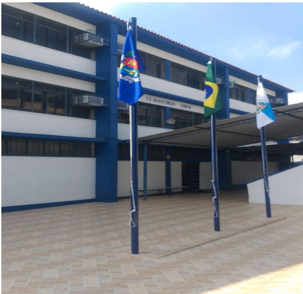
Colégio Estadual Agostinho Porto.

De acordo com documentação constante do arquivo corrente do colégio, neste ano de 2022 a instituição acolhe 702 alunos matriculados, divididos entre o ensino fundamental, com 10 turmas, ensino médio, com 8 turmas, e EJA, com 6 turmas. No período pandêmico, entre os anos de 2020 e 2021, somente os alunos que desistiram do processo de ensino remoto contabilizaram o índice de reprovação. Os demais foram aprovados, porém ingressando na modalidade de continuidade curricular. Nos anos anteriores à pandemia, de acordo com a secretaria escolar, o índice de reprovação foi entre 12% a 15% dos alunos, não sendo considerado um índice incomum para anos sem intercorrências graves.