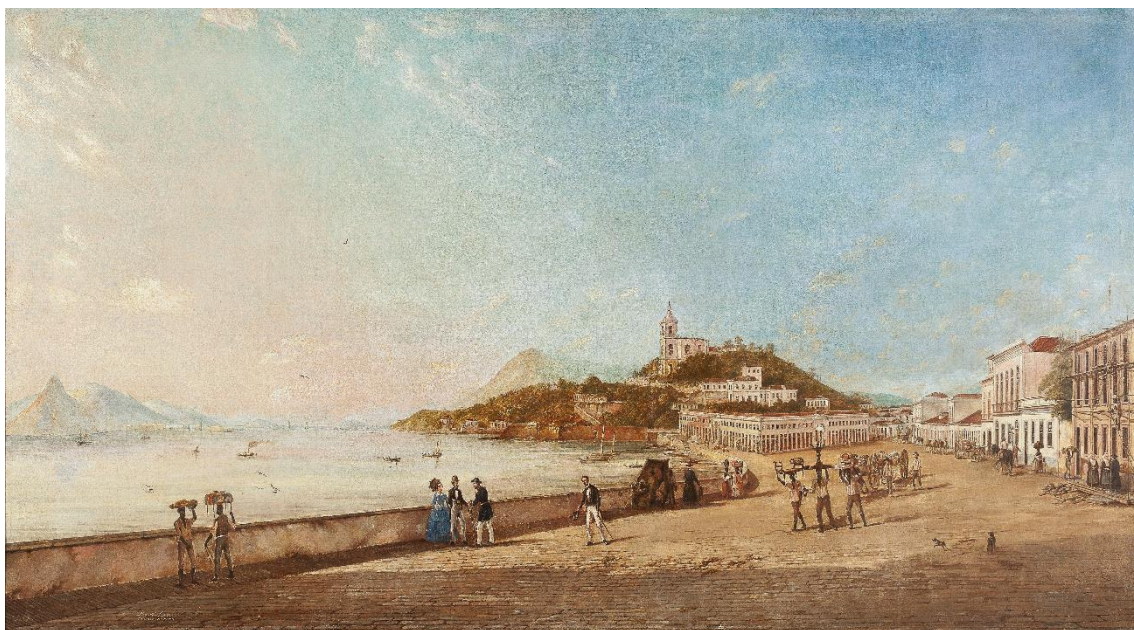
BERTICHEN, Pieter Godfred. Vista da entrada do Rio de Janeiro s/d. Óleo sobre tela, 80,5 X 141 cm. Acervo Museu Imperial. 134

Além desta obra, usualmente a presença negra aparece em exposição no Museu Imperial na Sala de Joias, em balangandãs de prata e berloques usados por escravizadas da Bahia. Infelizmente, por conta de serviços de manutenção, não haviam joias em exposição durante nossa visita escolar, apenas o cofre de porcelana, biscuit e bronze dourado que pertencera a François d’Orleans, o príncipe de Joinville, que se casou com a princesa d. Francisca, irmã de D. Pedro II.