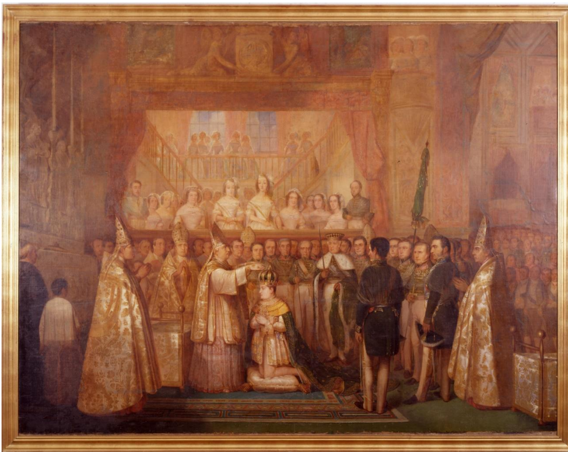
MOREAUX, François-René. Sagração e coroação de d. Pedro II em 18 de julho de 1841; 1842, óleo sobre tela, 2,38m x 3,10m. Coleção Museu Imperial. 32

Em 1850, o contrabando negro passou a ser fiscalizado com rigor no Brasil, com a aprovação da Lei Eusébio de Queiroz. O fim do tráfico formal e a alta mortalidade do escravizado, devido às suas péssimas condições de vida no cativeiro, logo reduziram a população escravizada, que se tornou mais cara. Os proprietários de terra, principalmente os cafeicultores do complexo cafeeiro paulista, que ganhavam centralidade em relação à produção cafeeira do território fluminense (TAUNAY, 1939), começaram a buscar formas de garantir a continuidade de sua produção, apostando no incentivo à imigração europeia.