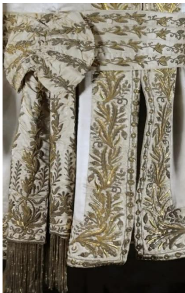
Traje majestático - faixa. Bordada com fios de ouro formando lírios e campânulas em cada uma das quatro pregas, dispostos no sentido horizontal. A faixa contorna a cintura da veste e é arrematada, no lado direito, por laço do qual pendem duas pontas com franjas de canutilhos dourados. Material: cetim branco e fios de Ouro. Dimensões: 25 cm (largura). Coleção Família Imperial. 109