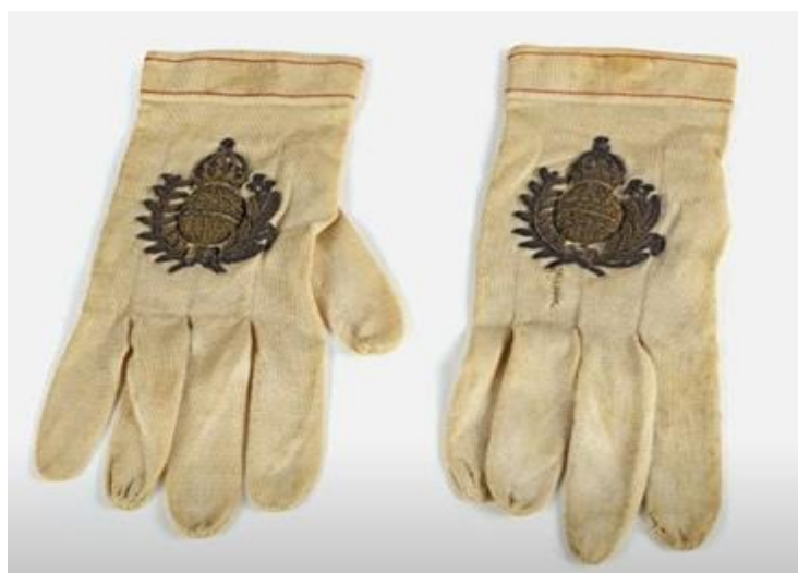
Traje majestático - Luvas. Luvas com as armas do Império bordadas a ouro, confeccionadas em ocasião posterior à sagração e coroação, em 1851. Material: seda e fios de ouro. Dimensões: 10 cm (largura) x 20,8 cm (comprimento). Coleção Família Imperial. 113

O amarelo aparecia na muça, feita com papo-de-tucano 114 , uma ave típica do Império do Brasil. Essas penas amarelo-fogo foram um elemento originalmente brasileiro