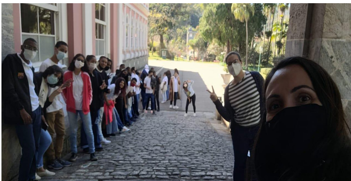
Visita de alunos do 2º ano do Ensino Médio do Colégio Estadual Agostinho Porto ao Museu Imperial em 23/06/2022.