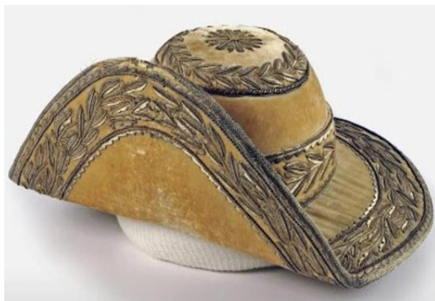
Traje Majestático - Chapéu. Utilizado pelo imperador dom Pedro II no dia de sua sagração e coroação. Possui aba frontal levantada, adornado com ramos e folhas de carvalho. Material: veludo branco e linhas de ouro. Dimensões 14 cm (altura) x 42 cm (largura) x 38 cm (comprimento). Coleção Família Imperial. 112