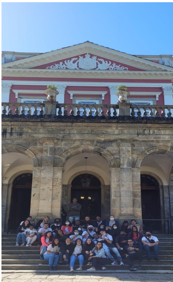
Visita de alunos do 2º ano do Ensino Médio do Colégio Estadual Agostinho Porto ao Museu Imperial em 13/06/2022.