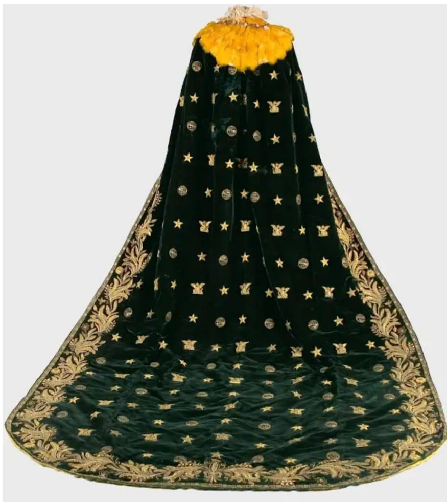
Manto Imperial de D. Pedro II. Material: Veludo verde, lhama dourada, cordão e fios de ouro, canutilhos (fosco, brilhante e frisado), lantejoulas e palhetas. Dimensões: 305 cm (altura) x 193 cm (largura). Coleção Museu Imperial. 117

Como complemento do traje majestático, haviam as insígnias, em que eram representadas as ordens honoríficas 118 . D. Pedro II adotava algumas no traje, tais como as insígnias da Ordem Imperial do Cruzeiro 119 , da Ordem D. Pedro I Fundador do Império 120 , e da Ordem da Rosa 121 .