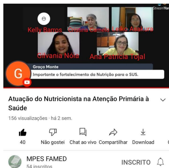
FIGURA 4 – Tela da apresentação com as palestrantes e mediadoras