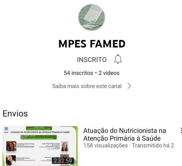
FIGURA 1 – Canal utilizado para apresentação do webinar