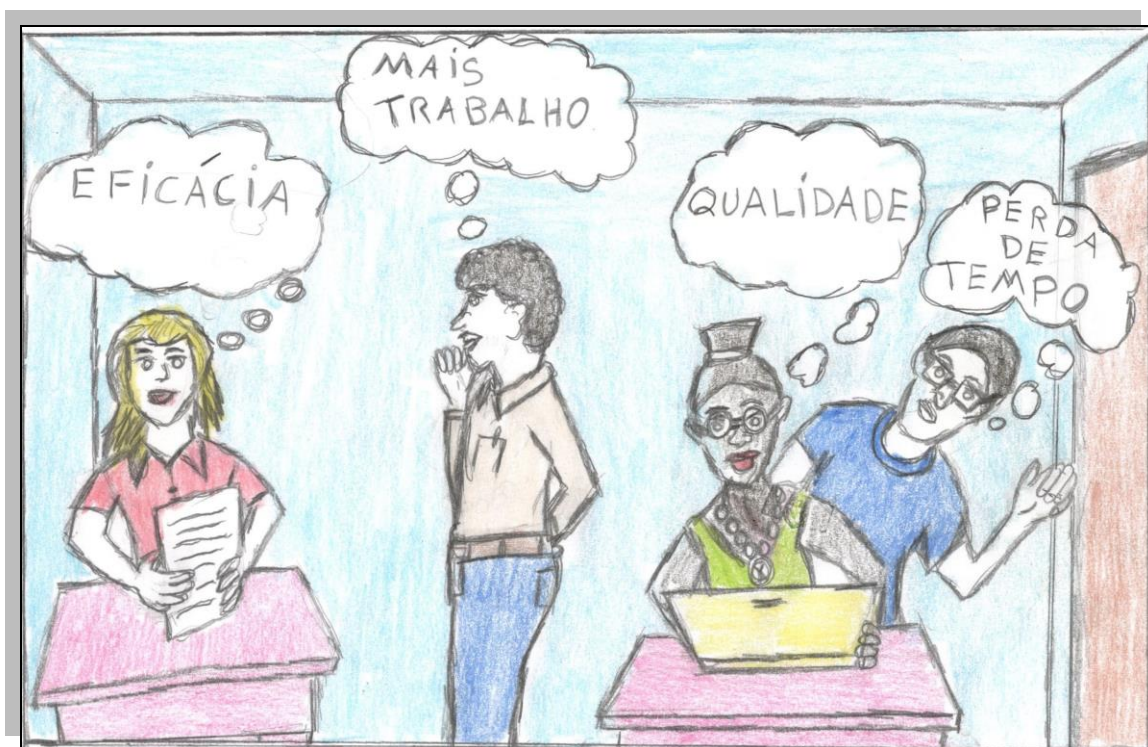
Ilustração: Freitas (2022).

Art. 11. As políticas para a Formação ao Longo da Vida, em Serviço, implementadas pelas escolas, redes escolares ou sistemas de ensino, por si ou em parcerias com outras instituições, devem ser desenvolvidas em alinhamento com as reais necessidades dos contextos e ambientes de atuação dos professores (BRASIL, 2020 p. 5).