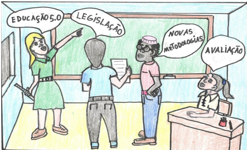
Ilustração: Freitas (2022).