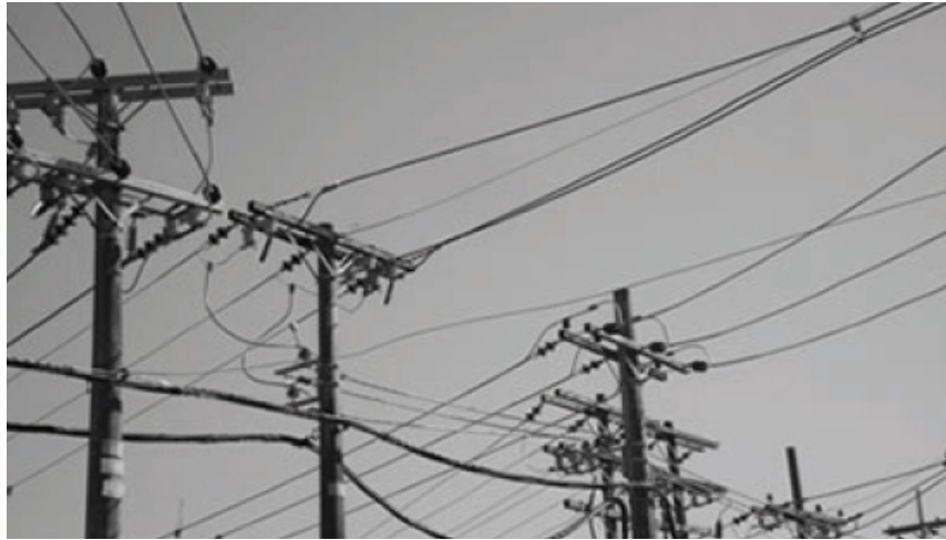
Figura 2: Exemplo de Falha de Competição (Monopólio Natural) – Distribuição de Energia