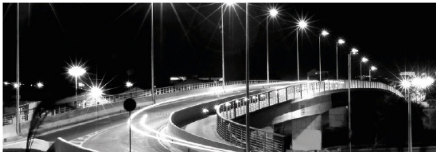
Figura 1: Exemplo de bem público