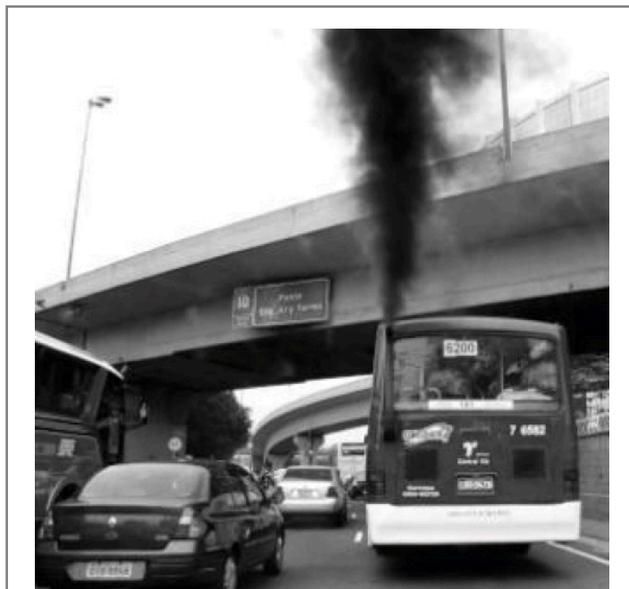
Figura 3: Exemplo de Externalidade Negativa – Poluição por Veículos