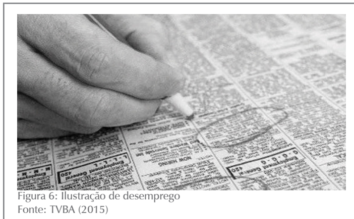
Figura 6: Ilustração de desemprego