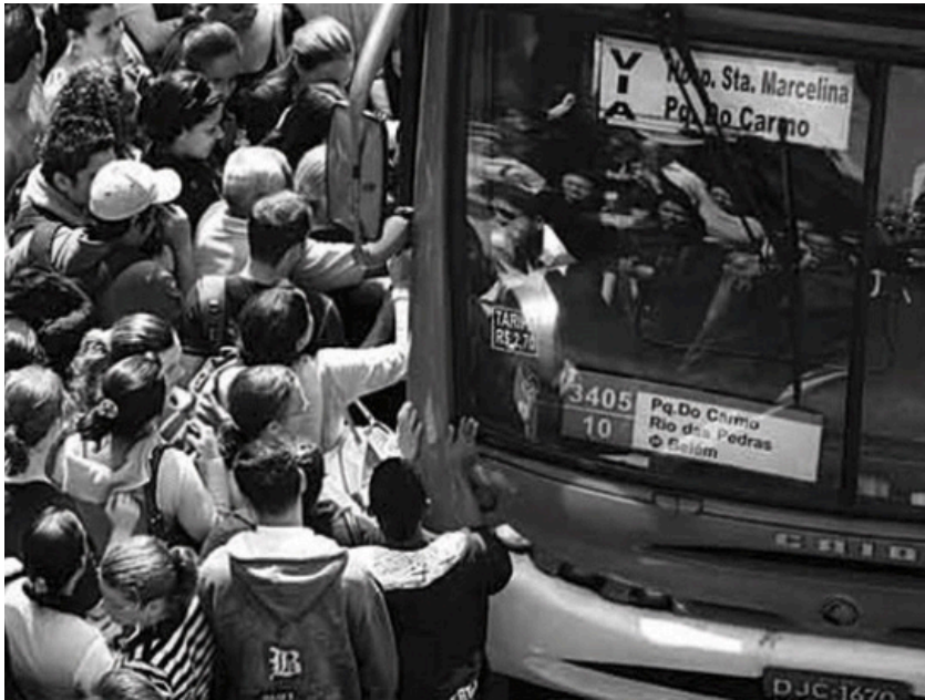
Figura 7: Transporte público – responsabilidade do governo

O governo também é responsável por prover os bens meritórios* , também chamados de semipúblicos, que tem um perfil transitório entre públicos e privados. Nesse grupo se classificam principalmente os serviços de educação e de saúde. Embora possam ser diretamente explorados pelo setor privado, esses serviços trazem consigo uma gama de benefícios sociais e externalidades positivas, o que faz com que eles se tornem importantes para a gestão pública.