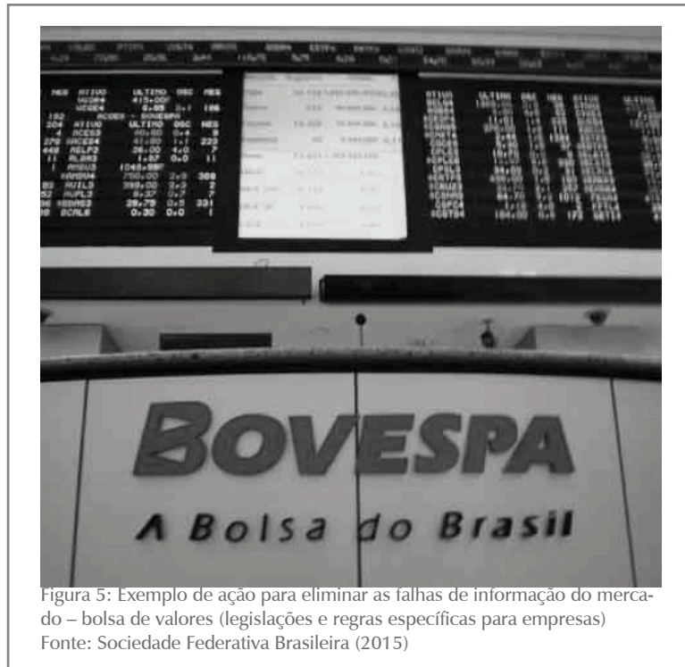
Figura 5: Exemplo de ação para eliminar as falhas de informação do mercado – bolsa de valores (legislações e regras específicas para empresas)