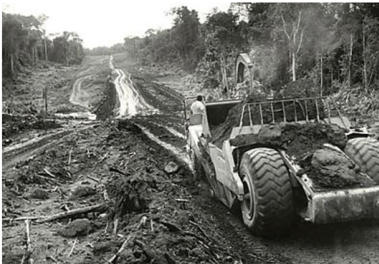
Figura 4: Exemplo de mercado incompleto – construção de rodovia em região remota (rodovia Transamazônica)