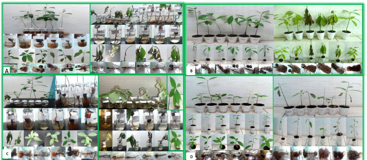
Figura 2. Síntomas de la enfermedad en plantas de aguacate en vivero y laboratorio con concentraciones de 1 \times 10^6 y 1 \times 10^9 A) Plantas inoculadas con Melanospora sp. en laboratorio con las dos concentraciones utilizadas. B) Plantas inoculadas con Verticillium sp. en vivero con las dos concentraciones utilizadas. C) Plantas inoculadas con P. cinnamomi en laboratorio con las dos concentraciones utilizadas) Plantas inoculadas con Cyindrocarpon sp. en vivero con las dos concentraciones utilizadas.