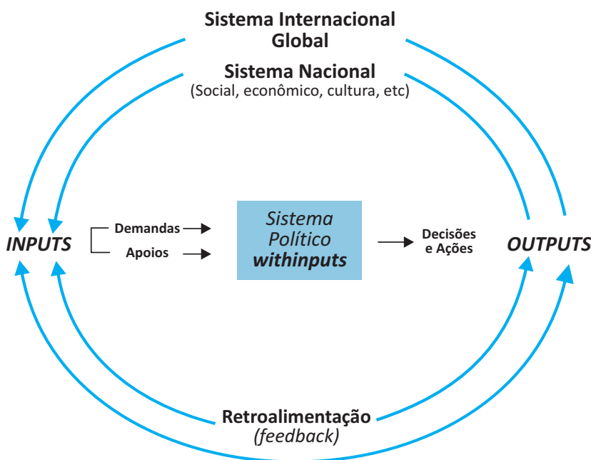
Figura 1: Sistema político

Os inputs são as demandas e apoios encaminhados ao sistema político. Podem ser, por exemplo, reivindicações de bens e serviços, como saúde, educação, estradas, transportes etc. ou demandas por participação, como direito ao voto ou à representação política. Os apoios nem sempre estão vinculados a demandas ou políticas específicas –, mas podem estar direcionados ao próprio sistema político, ou para quem governa. Exemplos de apoio são a obediência civil (o cumprimento de leis e regulamentos); a participação política, mesmo no simples ato de votar; o respeito à autoridade do Estado e suas instituições. Estes são apoios passivos , pois não exigem nenhum esforço especial por parte dos atores envolvidos e podem resultar até mesmo da conformidade obtida mediante a socialização. Mas há apoios também ativos , como o envolvimento na implementação de determinados programas governamentais, a participação em manifestações públicas, etc. Além disso, os apoios podem ser afirmativos , que é quando expressam legitimação, credibilidade; ou, negativos , quando representam a negação da legitimidade. A sonegação de impostos, a abstenção eleitoral, as manifestações popu-