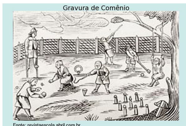
Figura 2: Gravura do próprio Comênio para um de seus livros de texto: aprender brincando

Deve-se a Comênio, justamente, uma das primeiras e melhores definições de Didática que se conheça. Na quinta página de seu livro Didática Magna (1657/2001) afirmou: