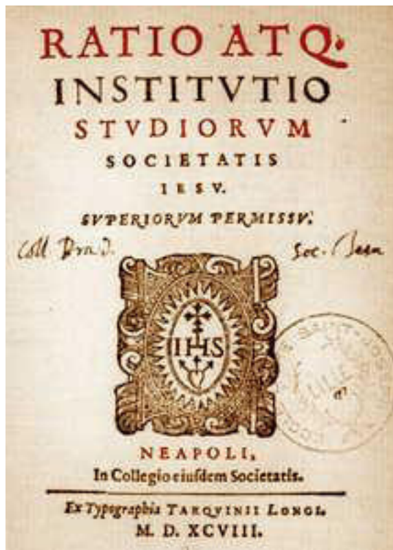
Figura 8: Ratio Studiorum

Por sua vez, caracterizam a pedagogia tradicional leiga (1827-1932), de acordo com Veiga (1988), a ênfase ao ensino humanístico de cultura geral, centrada no professor que transmite a todos os alunos indistintamente a verdade universal e enciclopédica; a relação pedagógica que se desenvolve de forma hierarquizada e verticalista, onde o aluno é educado para seguir atentamente a exposição do professor; o método de ensino calcado nos cinco passos formais de Herbart (preparação, apresentação, associação, generalização, aplicação). E conclui Veiga (1988).