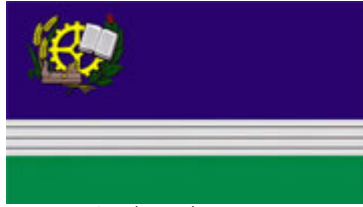
Figura 10: Bandeira do município de Rio Negrinho (SC)