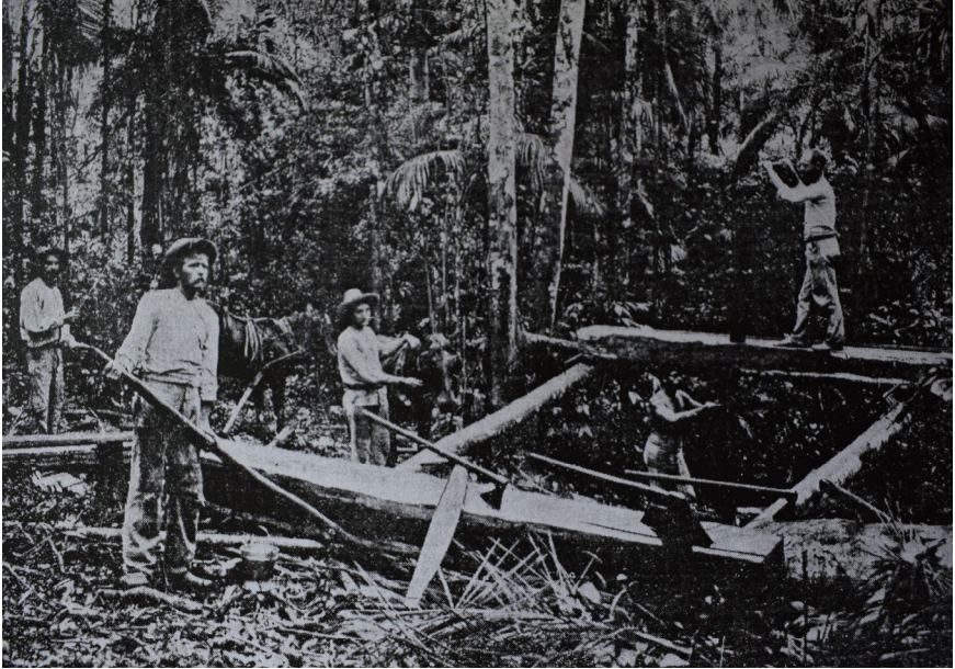
Figura 11: Homens cortando tábuas à mão