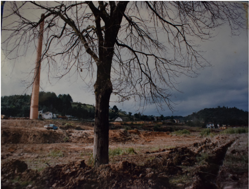
Figura 12: O carvalho europeu e a chaminé da antiga Móveis Cimo