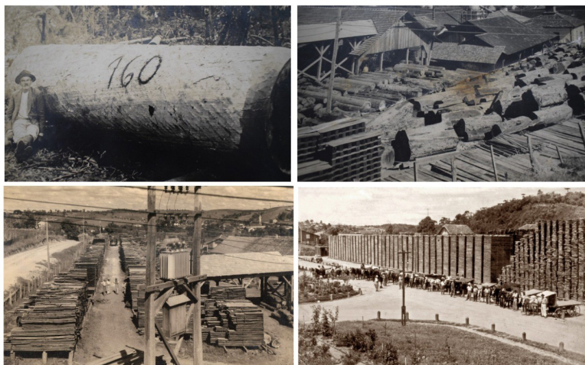
Figura 7: Imbuías e pinheiros serrados no pátio da Móveis Cimo (décadas de 20, 30 e 50)