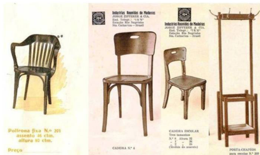
Figura 5: Folheto da Móveis Cimo