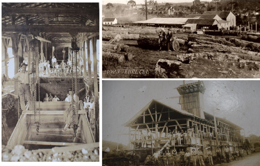
Figura 3: Indústrias Cimo e a construção no fim da segunda metade do século XX