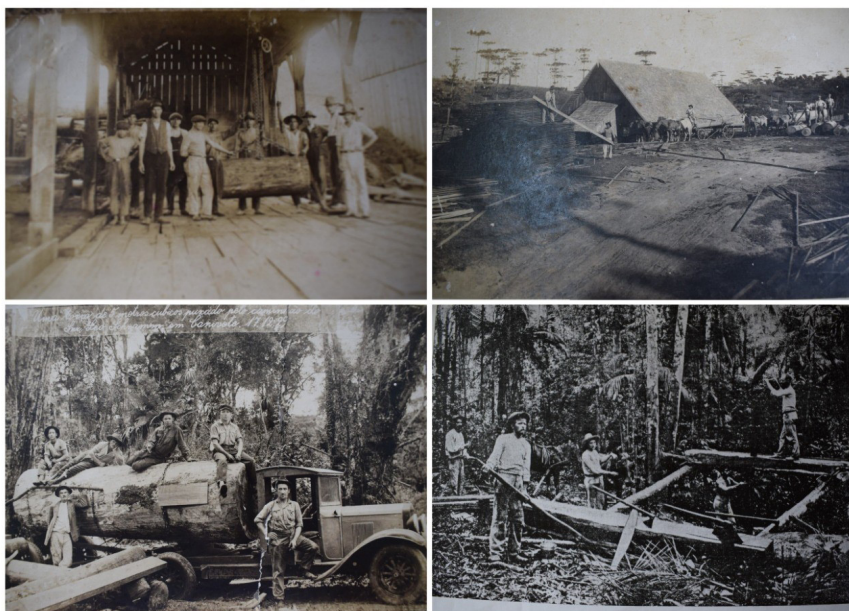
Figura 2: Fotos da serraria, operários, transporte e extração da madeira – início do século XX