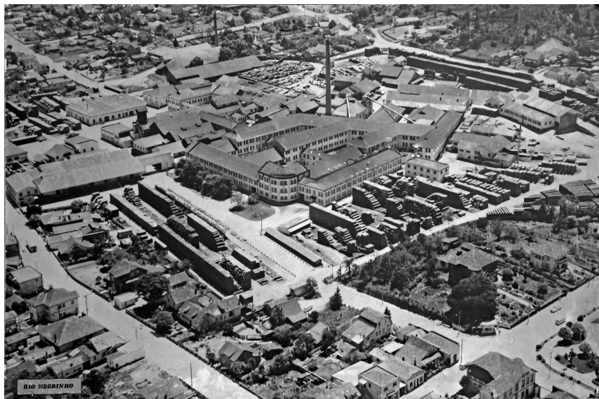
Figura 6: Móveis Cimo S.A. na década de 60

Como já mencionado, a indústria moveleira Móveis Cimo (e suas razões sociais antecessoras) teve enorme sucesso desde a serraria no Rio do Salto, em 1913, até 1953 e anos posteriores (figura 6), quando faliu em 1982 (SANTI, 2013).