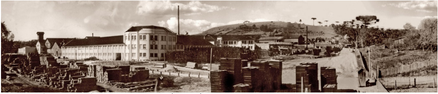
Figura 4: Foto panorâmica da Móveis Cimo na década de 60