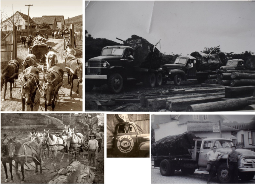
Figura 8: Transporte de toras para a Móveis Cimo nas décadas de 20/30 e 50/60