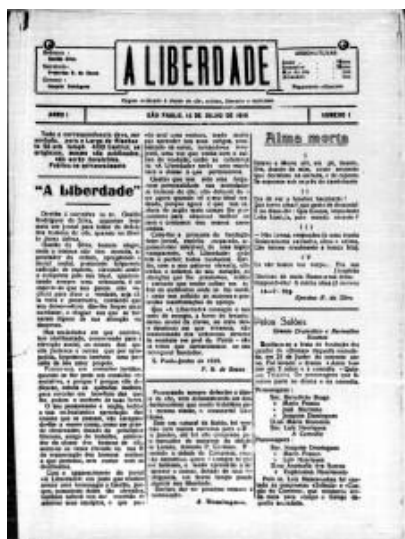
Figura 8 - A Liberdade

Subtítulo: órgão dedicado à classe de côr, crítico, literário e noticioso.