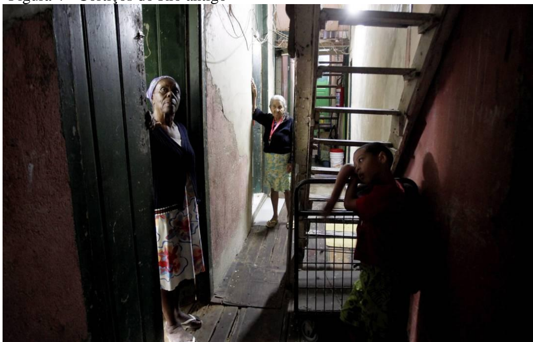
Figura 4 - Cortiços do Rio antigo