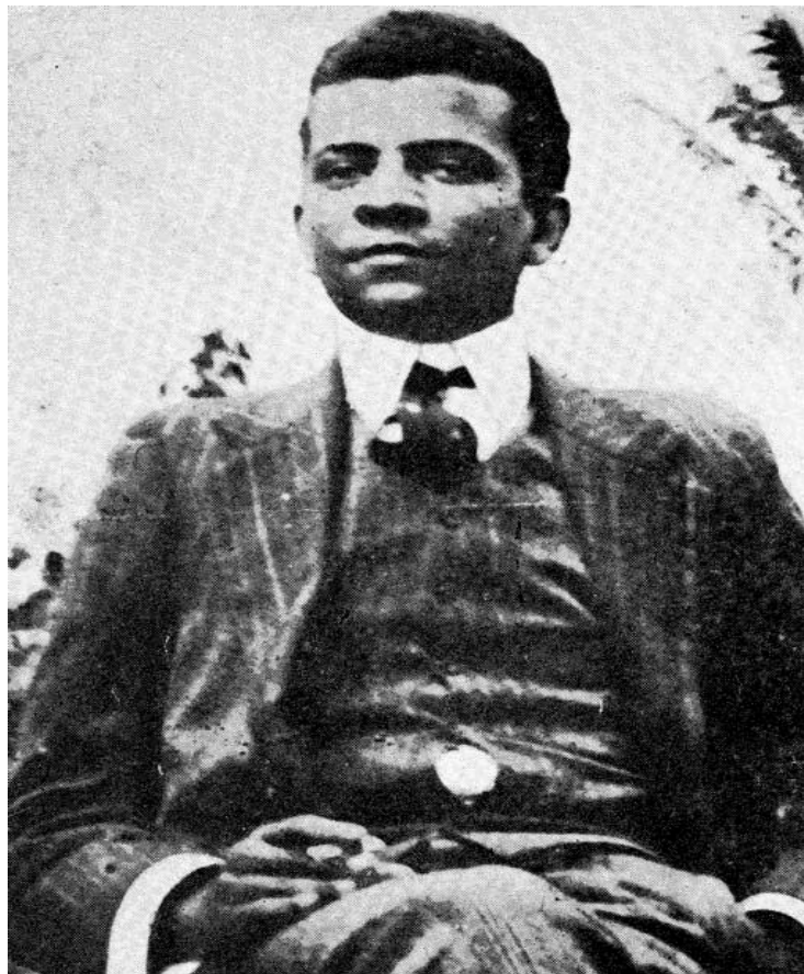
Figura 12 - O escritor Afonso Henriques de Lima Barreto

Afonso Henriques de Lima Barreto nasceu em 1881 na cidade do Rio de Janeiro. Enfrentou o preconceito por ser mestiço durante a vida. Ficou órfão aos sete anos de idade de mãe e, algum tempo depois, seu pai foi trabalhar como almoxarife em um asilo de loucos chamado Colônia de Alienados da Ilha do Governador. Concluiu o curso secundário na Escola Politécnica, contudo, teve que abandonar a faculdade de Engenharia, pois seu pai havia sido internado, vítima de loucura, e o autor foi obrigado a arcar com as despesas de casa. Como leu bastante após a conclusão do segundo grau, sua produção textual era de excelente qualidade, foi então que iniciou sua atividade como jornalista, sendo colaborador da imprensa.