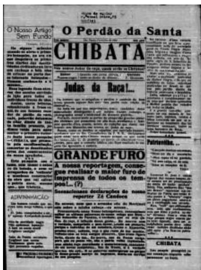
Figura 9 - Chibata

Periodicidade: quinzenal (1919)/ mensal (1920)