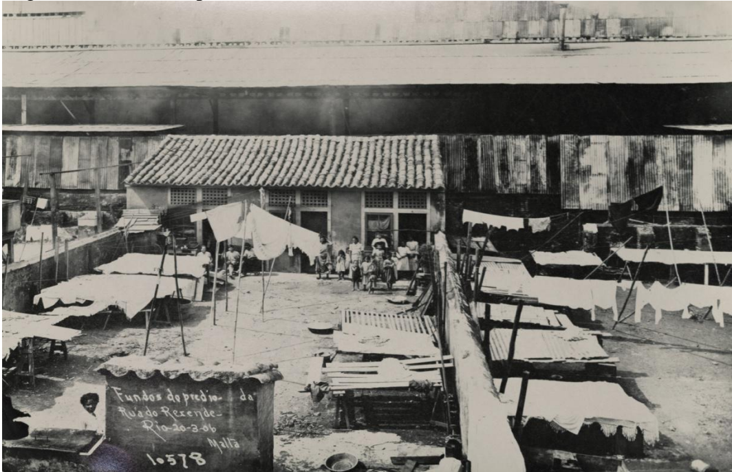
Figura 2 - Fundos de prédio na Rua do Rezende

Legenda: As habitações precárias, não raro transformadas em cortiço ou casa de cômodos, eram alvos da política do “bota-abaixo”