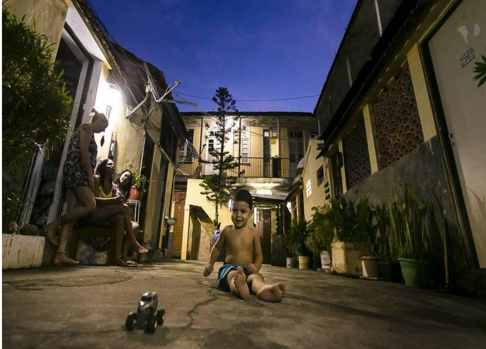
Figura 5 - Cortiço da Rua Senador Pompeu 65

Legenda: Um dos cortiços mais antigos da cidade fica na Rua Senador Pompeu 65, perto do antigo Cabeça de Porco, demolido em 1893 na rua paralela.