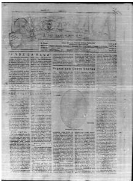
Figura 10 - A Voz da Raça

Subtítulo: órgão dedicado à classe de côm, crítico, literário e noticioso.