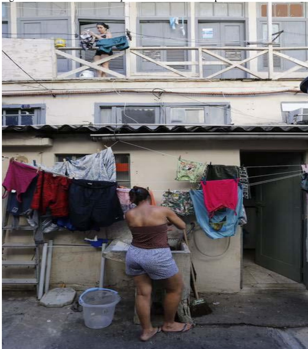
Figura 7 - Moradores do cortiço da Rua Senador Pompeo 65

Legenda: Embaixo, casas com quarto, sala e banheiro; em cima, apenas quartos de cinco metros quadrados.