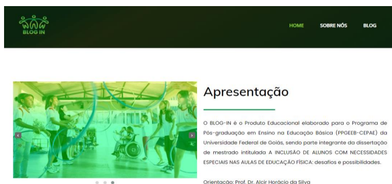
Figura 2 – Página inicial do BLOG-IN

O BLOG-IN foi estruturado em três páginas, podendo ser reestruturado se houver necessidade de acréscimo de informações. Na primeira página “HOME” colocamos a Apresentação/Editorial, que traz informações sobre o produto educacional, o programa e dissertação de que faz parte: