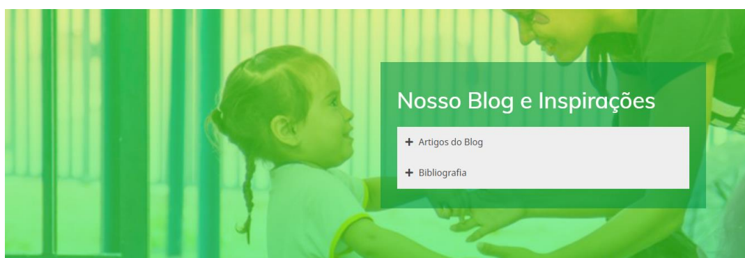
Figura 4 - Nosso Blog e Inspirações

Na parte direcionada ao “Nosso Blog e Inspirações” trazemos a parte onde podemos colocar artigos e trazer nossa bibliografia utilizada na dissertação e no produto educacional como forma de instigar mais os possíveis visitantes e leitores do blog.