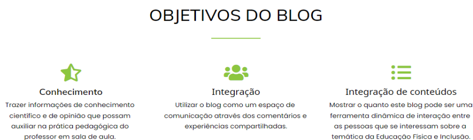
Figura 5 - Objetivos do blog