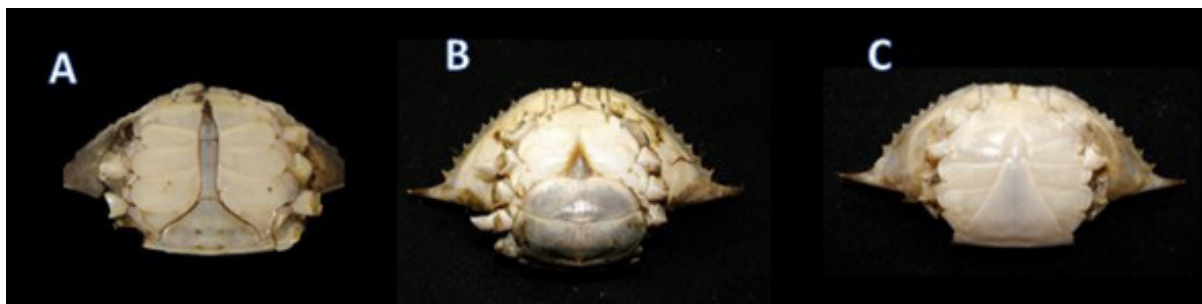
Figura 1. Identificación de sexos por forma del abdomen de las especies del género Callinectes ; A) machos, B) hembras y C) hembras juveniles.

Se capturó un total de 552 organismos en la laguna de Mecoacán, de los cuales 354 correspondieron a la especie C. sapidus , 156