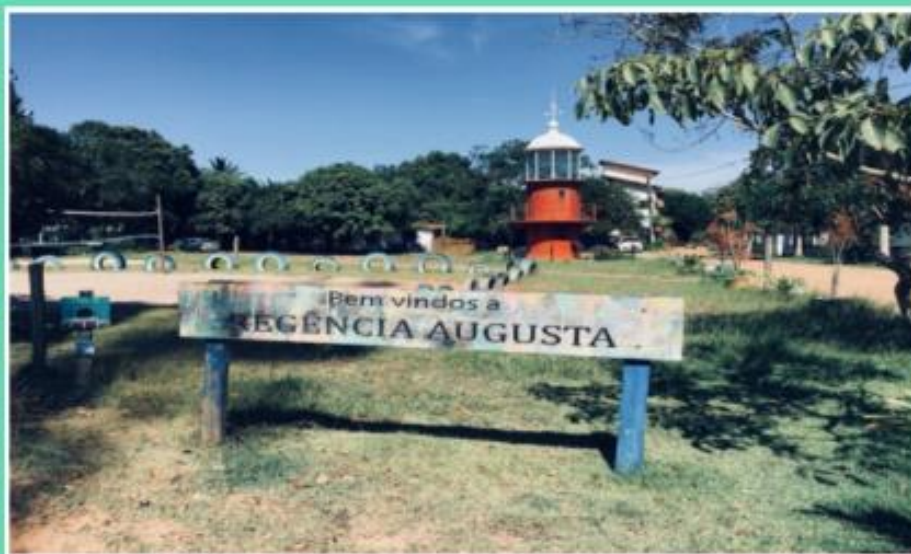
Fotografia: Placa de boas vindas na Vila de Regência

A Vila de Regência, historicamente de origem indígena (Botocudos do Rio Doce, do tronco linguístico Macro-Jê), é uma comunidade tradicional de pescadores, localizada na Foz do Rio Doce, próxima da Reserva Biológica de Comboios, no litoral do município de Linhares, região norte do estado do Espírito Santo.