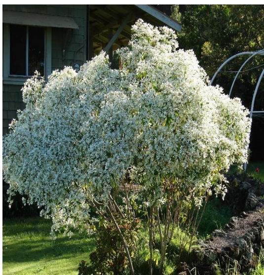
Figura 5 – Euphorbia leucocephala Lotsy

O vegetal popularmente conhecido como véu de noiva, cabeleira de velho, cabeleireiro de velho, cabeça de velho, neve da montanha, flor de criança, cabeça branca, leiteiro, é uma planta que pertence à família Euphorbiaceae denominada cientificamente de Euphorbia leucocephala Lotsy (Figura 5). Apresenta-se como arbusto de textura semi-herbácea, leitoso, de 2-3 m de altura, de caule marrom-claro, muito ramificado, de copa globosa, folhas elípticas e decíduas no inverno. As flores são brancas, muito numerosas e vistosas, reunidas em inflorescências densas. Se formam durante o outono, prolongando-se até o inverno. Aprecia temperaturas amenas florescendo melhor em regiões altas (SILVA; LEMOS, 2002).