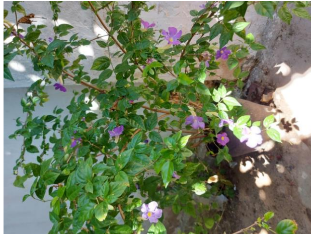
Figura 3 – Thunbergia erecta ( Thunbergia erecta (Benth.) T. Anderson)