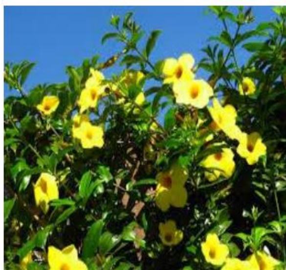
Figura 6 – Alamanda-amarela ( Allamanda cathartica L.)

A alamanda-amarela (Figura 6) com nome científico Allamanda cathartica L., pertencente à família Apocynaceae, é conhecida popularmente como alamanda, alamanda-amarela, carolina e dedal-de-dama (LORENZI; SOUSA, 1999). A alamanda-amarela floresce, principalmente na primavera e no verão. Essa planta é nativa de formações florestais de domínio atlântico do litoral norte, nordeste e leste do Brasil. A alamanda foi catalogada no ano de 1771 por Carl Linnaeus, e encontra-se registrada no Herbário Internacional de Berlim, sob o número 4.831 (SILVA, 2007).