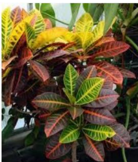
Figura 7 – Louro variegado ( Codiaeum variegatum (L.) A. Juss)