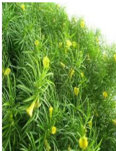
Figura 4 – Chapéu-De-Napoleão ( Thevetia peruviana (pers.) K. Schum)

O chapéu-de-napoleão (Figura 4) com nome científico Thevetia peruviana (pers.) K. Schum é popularmente conhecido devido à forma de seus frutos, também chamado com Acaimirim, Auáí-guaçu, Cerbera, Noz-de-cobra, é uma pequena árvore originária da América Central, mas largamente distribuída em todas as regiões tropicais devido ao seu aspecto ornamental (SCHVARTSMAN, 1979) e pertencente à família Apocynaceae.