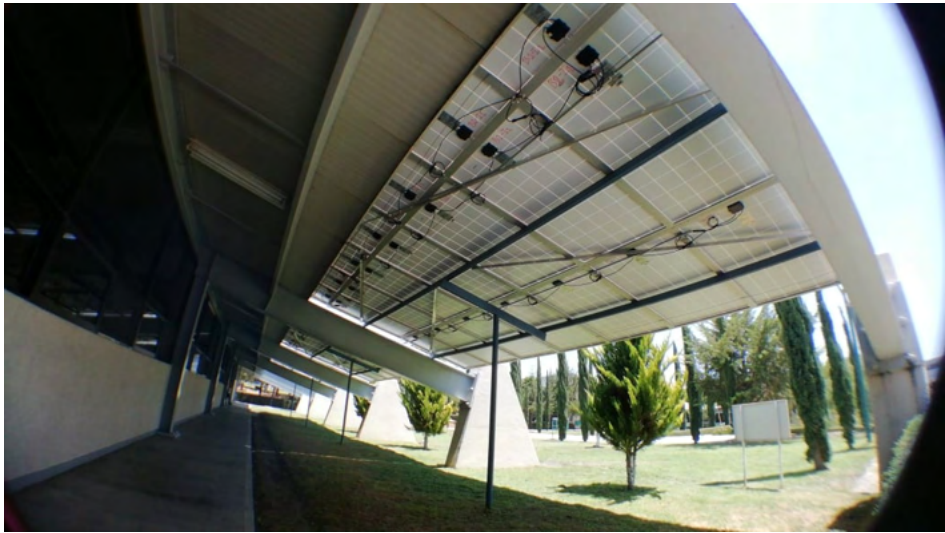
Figura 4. Instalación de los paneles fotovoltaicos.