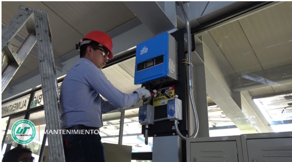
Figura 5. Instalación del sistema de control de los paneles fotovoltaicos.