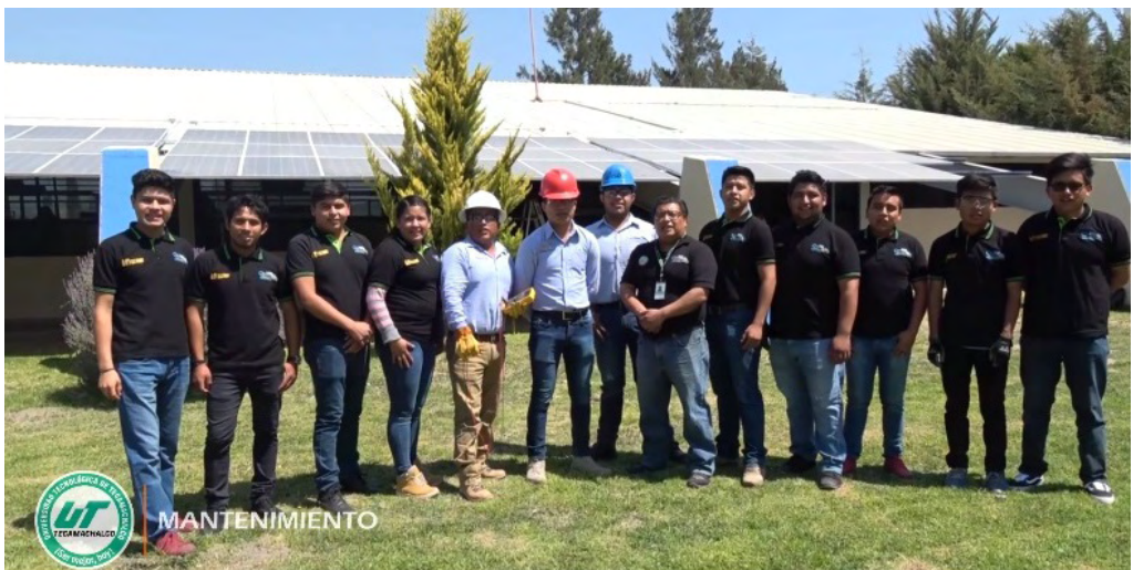
Figura 6. Alumnos y docentes participantes en la instalación de los paneles fotovoltaicos.