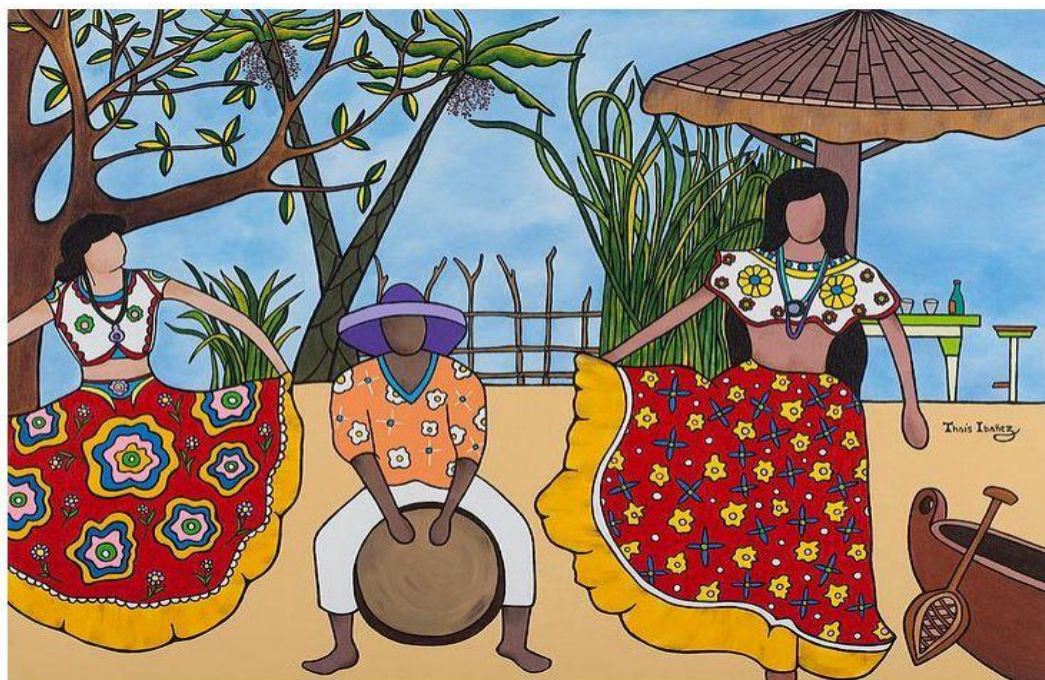
Dançando Carimbó 60x80cm - Óleo s/ tela - 2011

A música é bem ritmada e marcada, e a dança tem coreografias e em linha, com aproximações entre os pares e movimentos mais livres, mas sempre bastante marcados. Há momentos em que um casal ou uma dançarina vai para o centro da roda, fazendo brincadeiras de desafios com outros participantes. Recentemente, algumas formações trazem também a presença de outros instrumentos, como a guitarras, em um contraponto às formações tradicionais.