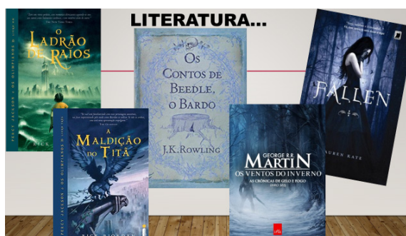
Figura 3 – Literatura contemporânea

Paralelo ao cinema, foram explorados livros da literatura contemporânea, presentes no universo dos estudantes, atravessados pelo universo medieval, como por exemplo: A Maldição do Titã (2007), de Rick Riordan; O Ladrão de Raios (2005), também de Rick Riordan; Os Contos de Beedle, O Bardo (2008), de J.K. Rowling; e Fallen (2009), de Lauren Kate. No geral, esses livros tratam de um mundo permeado pela magia, disputado por anjos, demônios e deuses. O mundo humano não se desvincula do mitológico, evocando as raízes de um mundo medieval.