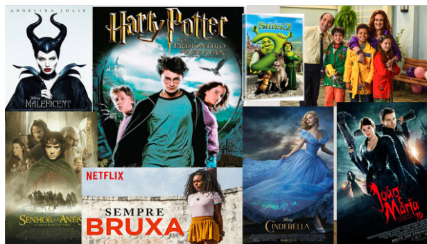
Figura 2 – Filmes trabalhados com o Ensino Médio