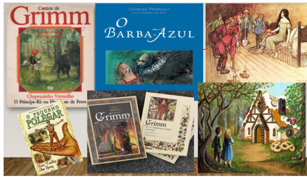
Figura 1 - Contos trabalhados no Ensino Médio