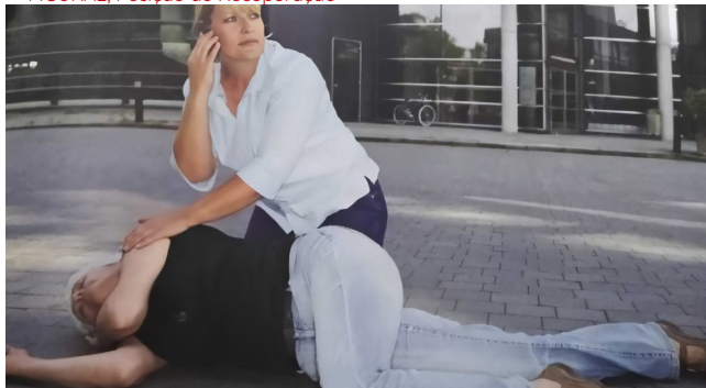
FIGURA2, Posição de Recuperação