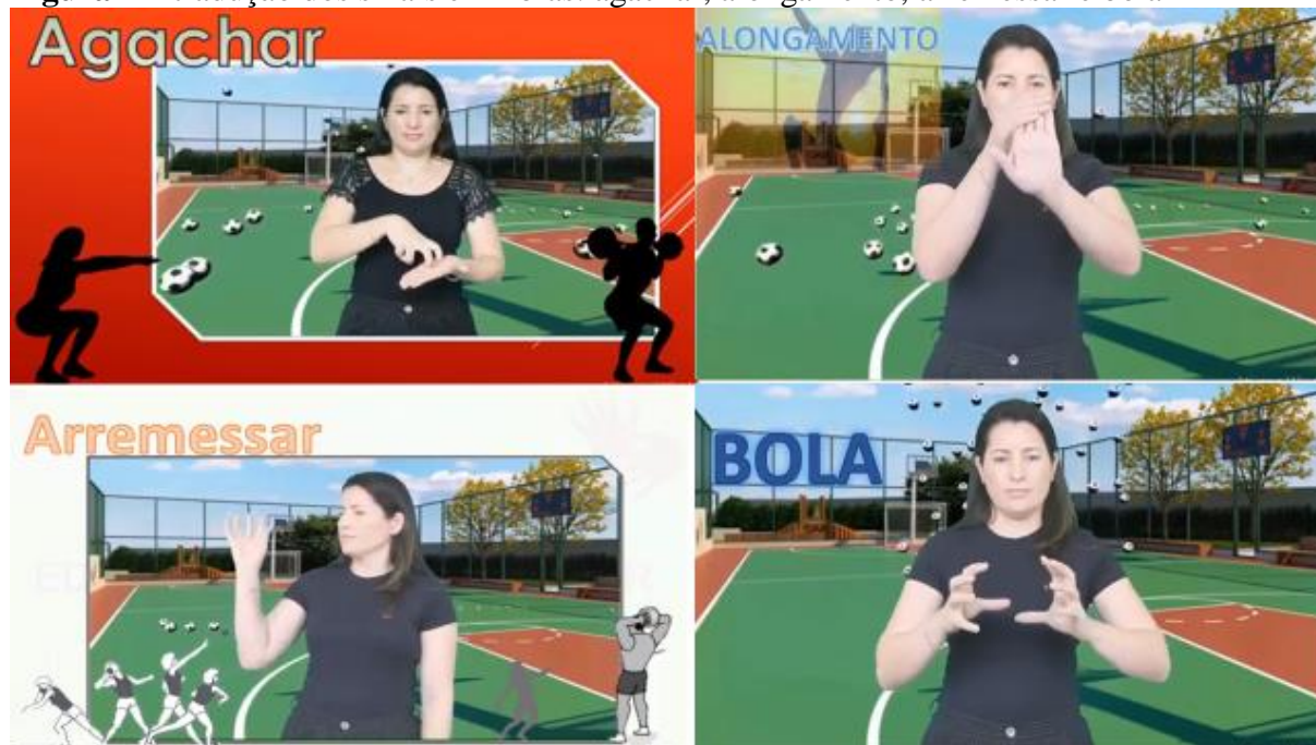
Figura 1 – tradução dos sinais em libras: agachar, alongamento, arremessar e bola