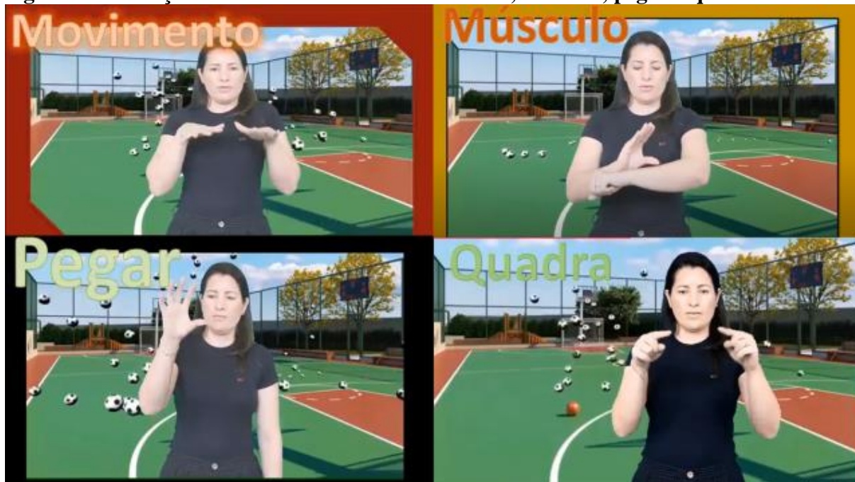
Figura 6 – tradução dos sinais em libras: movimento, músculo, pegar e quadra