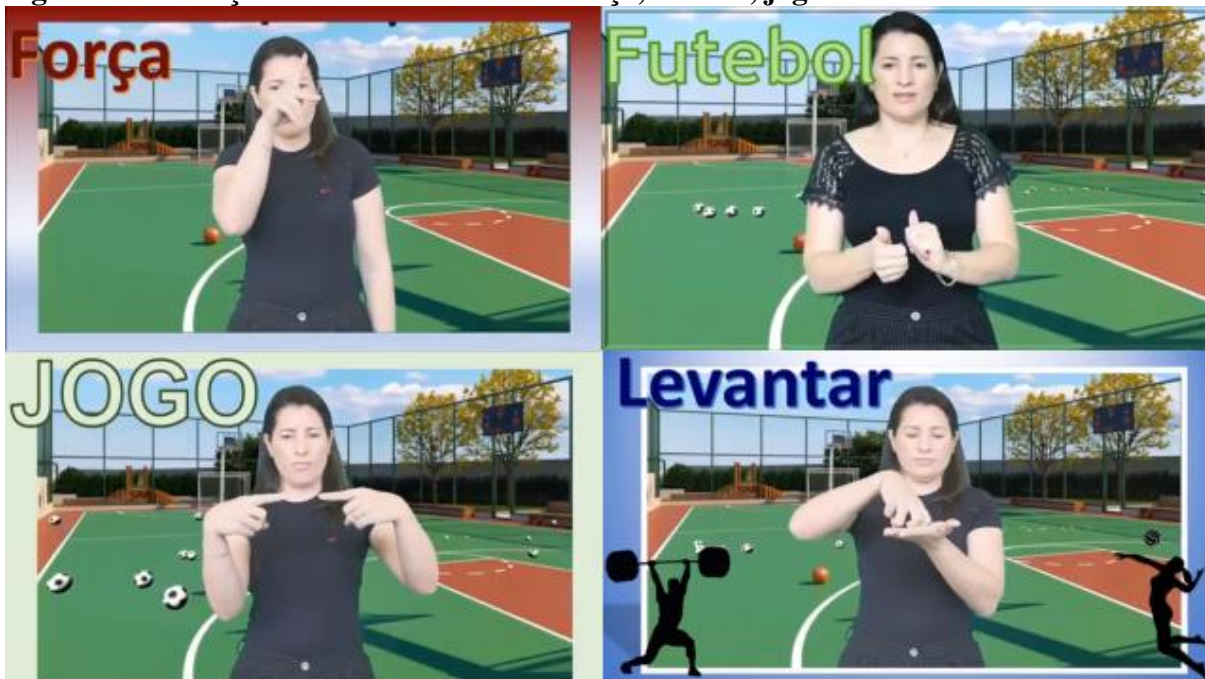
Figura 5 – tradução dos sinais em libras: força, futebol, jogo e levantar