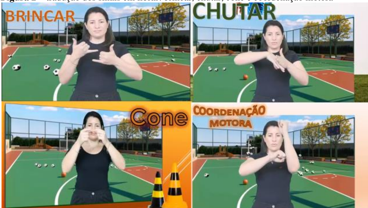
Figura 2 – tradução dos sinais em libras: brincar, chutar, cone e coordenação motora