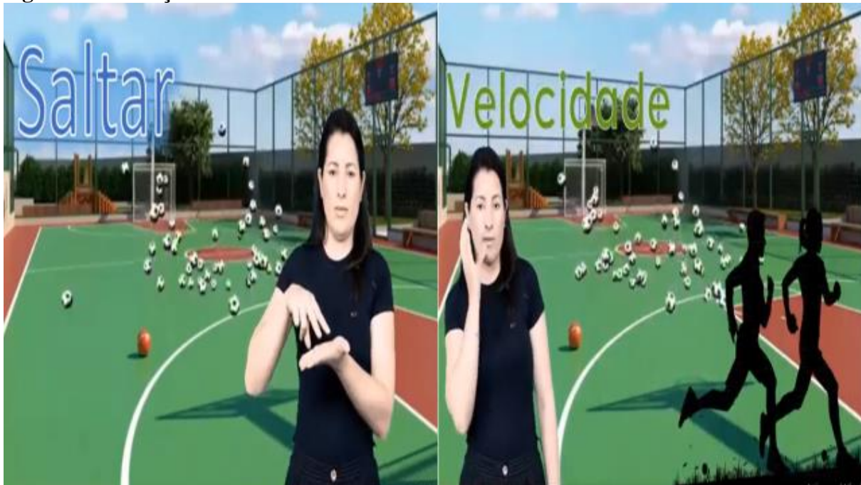
Figura 8 – tradução dos sinais em libras: saltar e velocidade