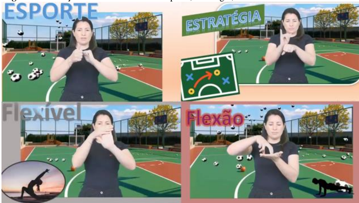
Figura 4 – tradução dos sinais em libras: esporte, estratégia, flexível e flexão