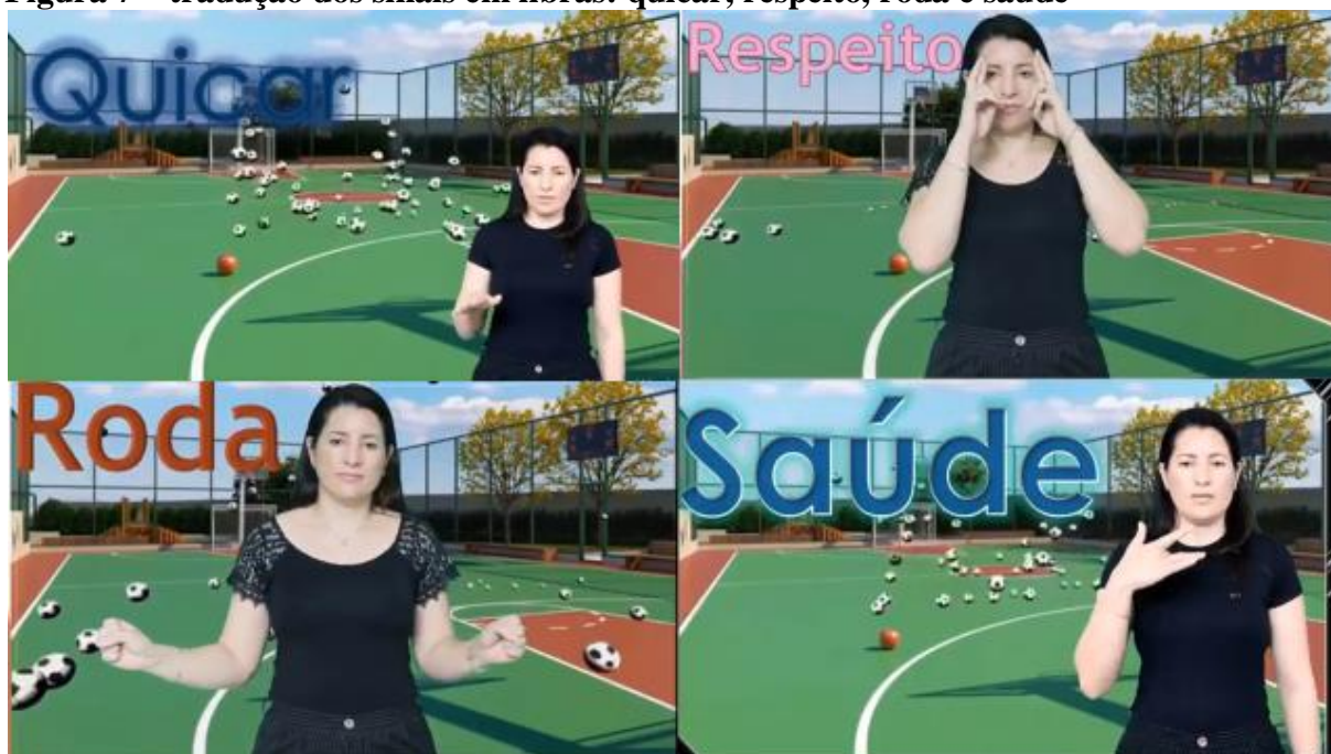
Figura 7 – tradução dos sinais em libras: quicar, respeito, roda e saúde