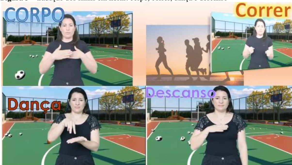
Figura 3 – tradução dos sinais em libras: corpo, correr, dança e descanso