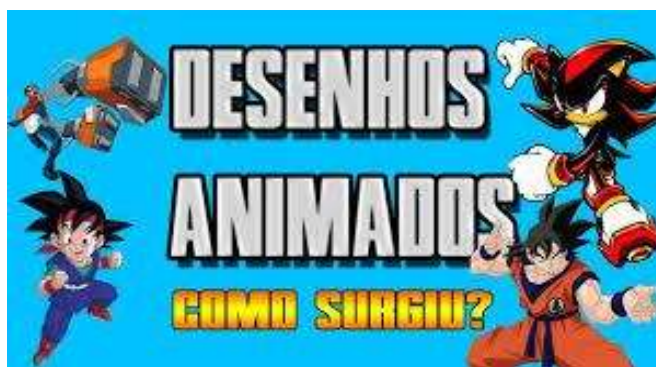
Figura 2 - Desenho animado.

Em seguida, instigue as crianças a comparar as suas hipóteses com o conteúdo apresentado no vídeo e a fazer comentários a respeito do que viram e ouviram.