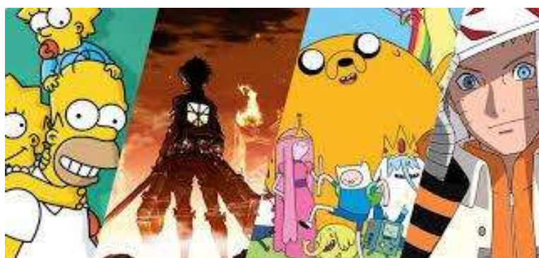
Figura 3 - Desenho animado é diferente do anime?