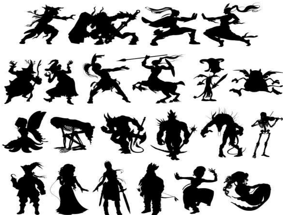
Figura 1 - Exemplo de Contornos de desenhos animados.