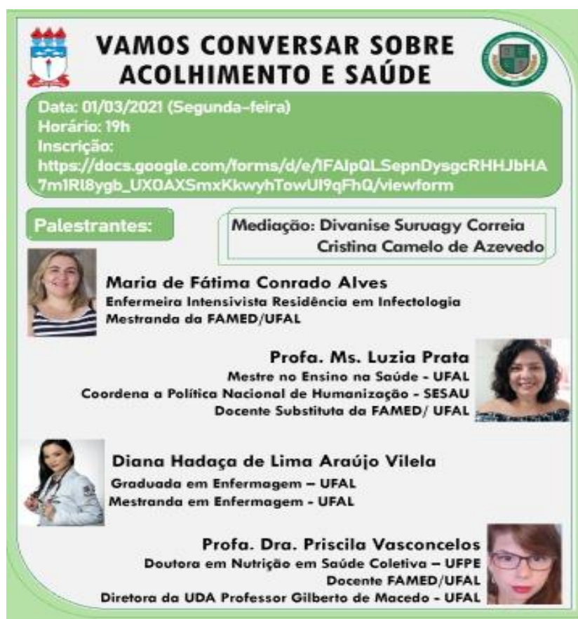
FIGURA 2 – Card de divulgação do evento