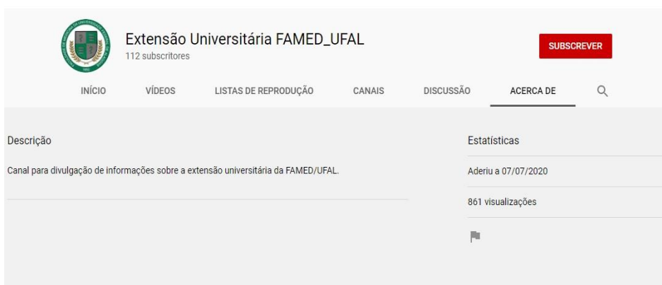
FIGURA 1 – Canal utilizado para apresentação do webinar.