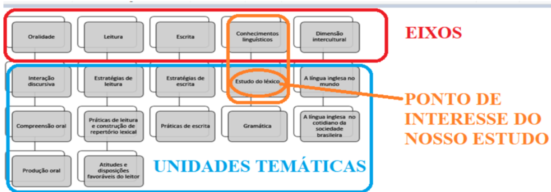
Figura 1 – Quadro dos eixos e unidades temáticas