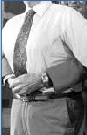
Henry Heimlich e a Manobra de Heimlich

A manobra foi inventada pelo médico estadunidense Henry Heimlich, em 1974, e pode ser praticada por qualquer pessoa, bastando que se siga corretamente as orientações: