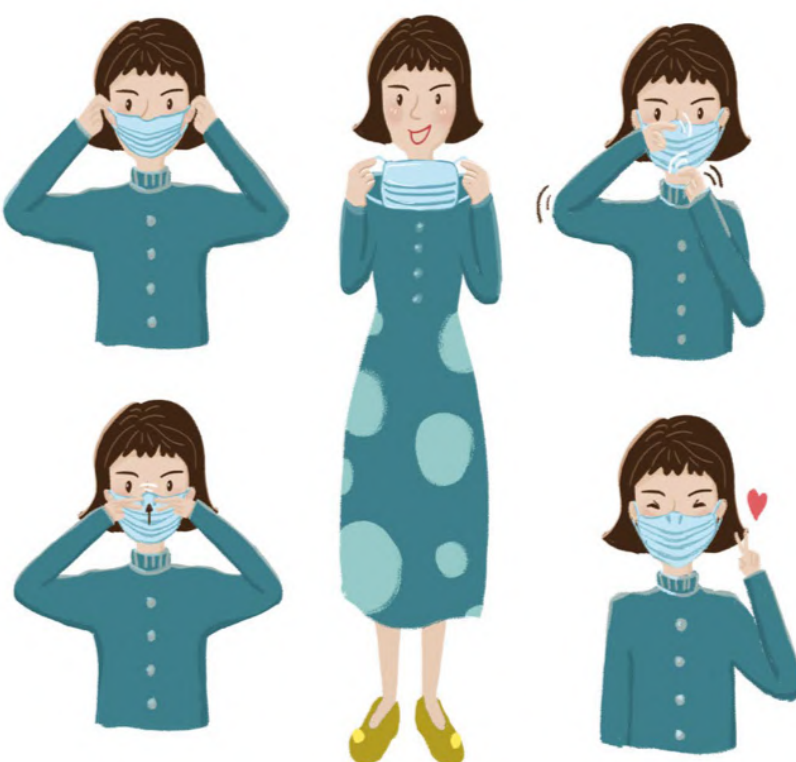
Atenção ao colocar e retirar máscara!!!